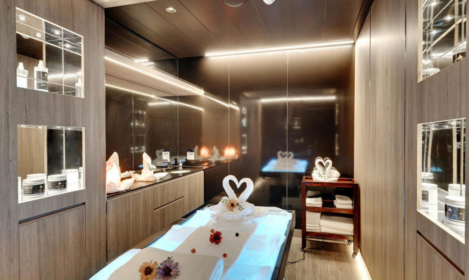
Nyd en luksuriøs behandling i Aurea Spa ombord på MSC Seaside