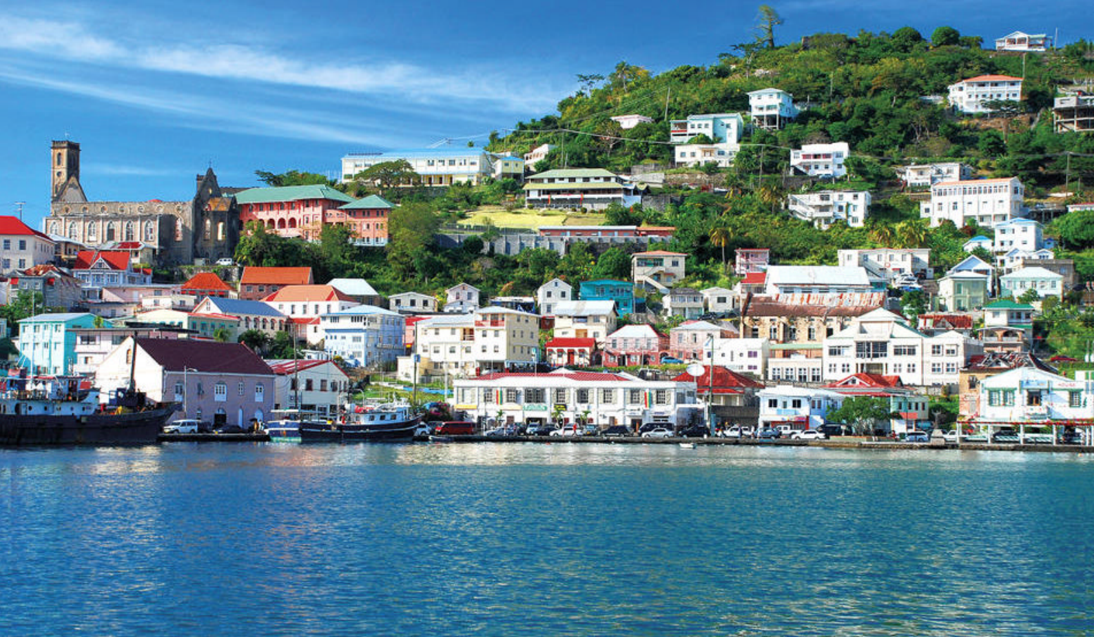
St. George's er hovedstaden på den caribiske ø Grenada og betragtes som en af de smukkeste havnebyer i verden

af spiritus og cocktails, alkoholfrie drikke, sodavand, juice pr. glas, mineralvand på flaske og varme drikke (kaffe, espresso, cappuccino, latte, varm chokolade og te). Du kan nyde dette tilbud i de fleste barer ombord, i selvbetjeningsbuffeten og i restauranterne, undtagen i specialrestauranterne.