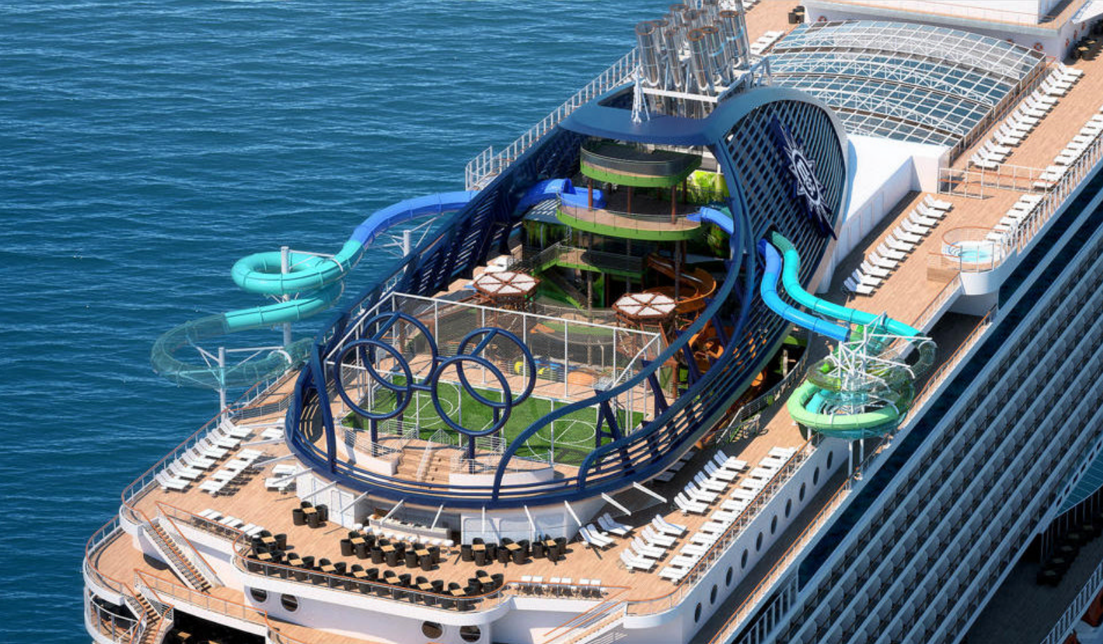
Nyd de mange faciliteter på MSC Seaside