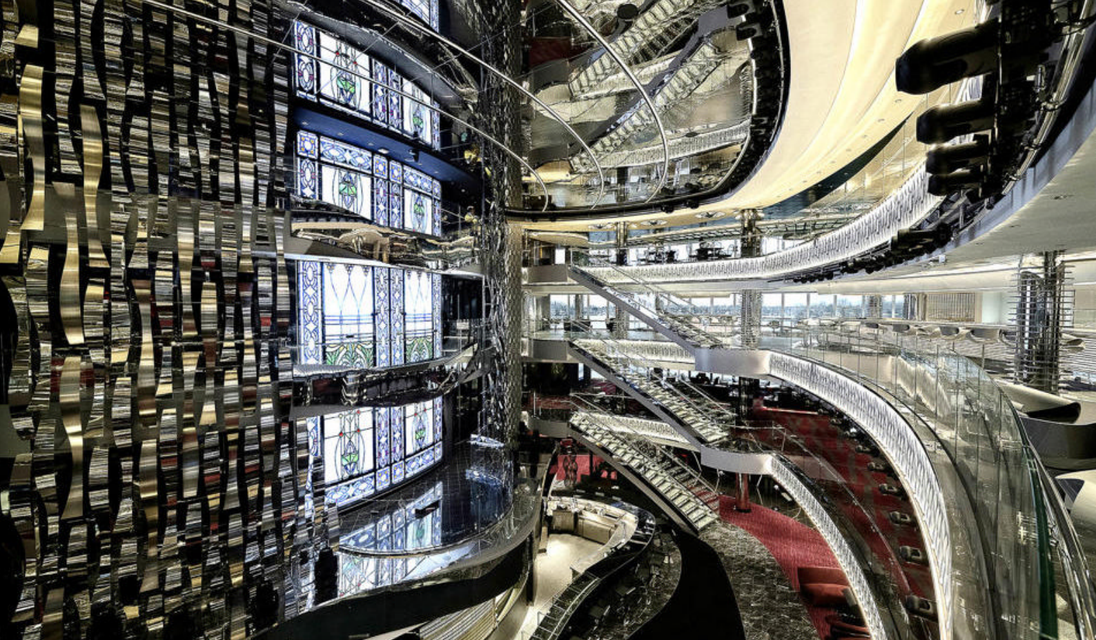
Seaside Atrium ombord på MSC Seaside byder på en glamouros oplevelse med sin spektakulære Swarovski-kronede trappe