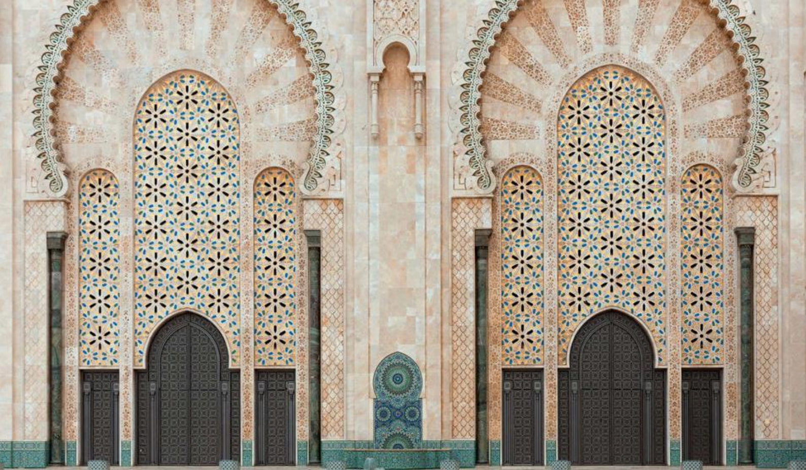
Oplev Marokkansk arkitektur i Casablanca, hvor den unikke skønhed kombinerer elementer fra arabisk, berberisk og andalusisk stil