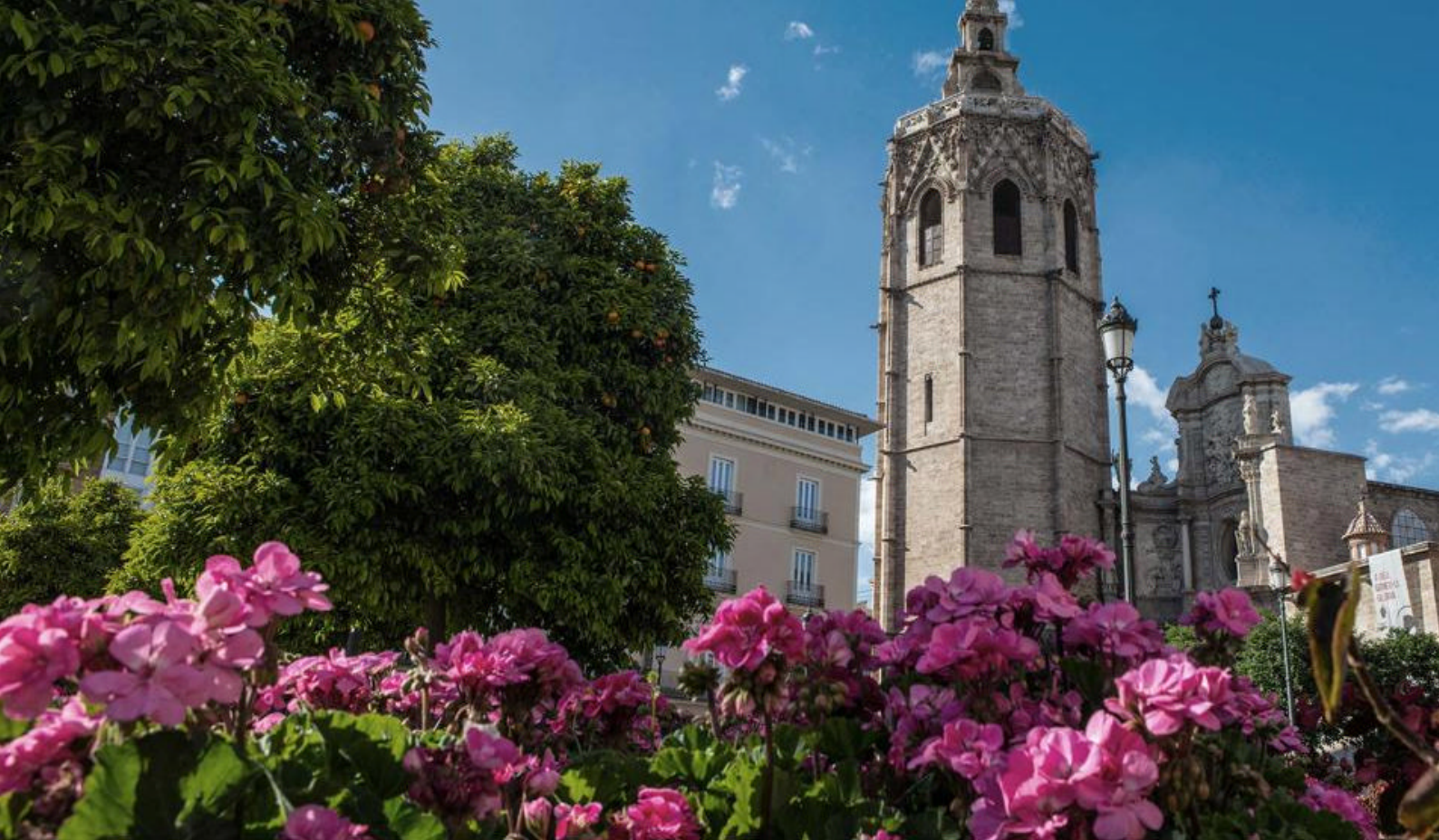
El Miguelete er et ikonisk klokketårn, der ligger i Valencia, Spanien