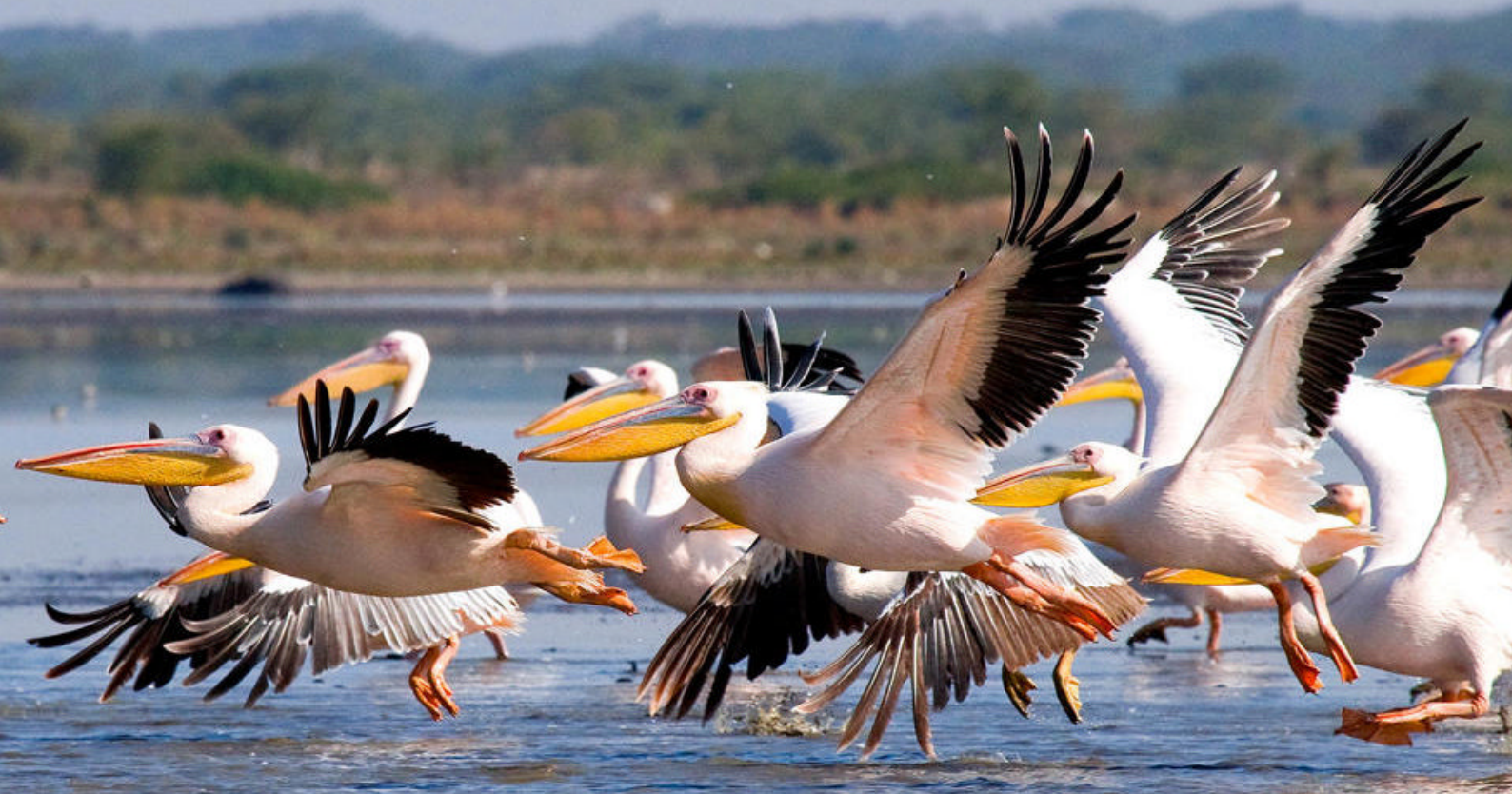
Pelikaner ved Lake Nakuru

i huset, se de forskellige værelser og mærk livet fra en anden tid.