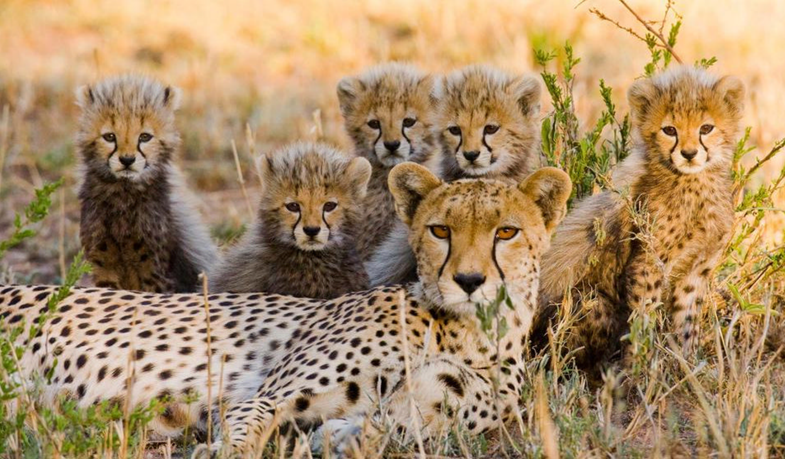
Geparder på savannen