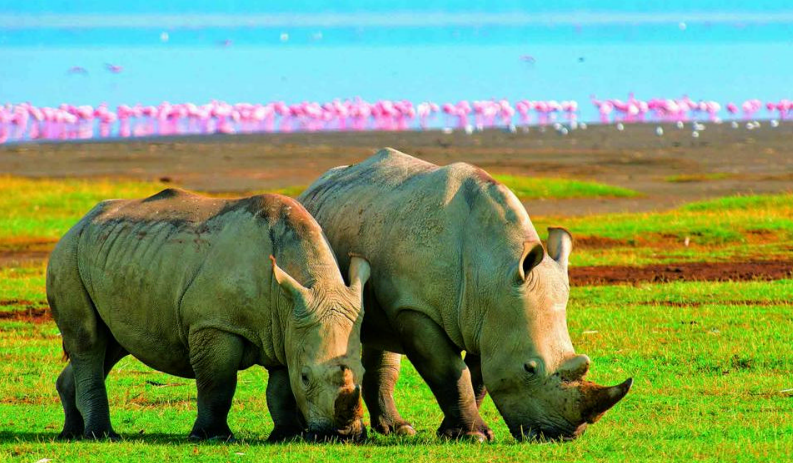
Flodhestene ved Lake Nakuru