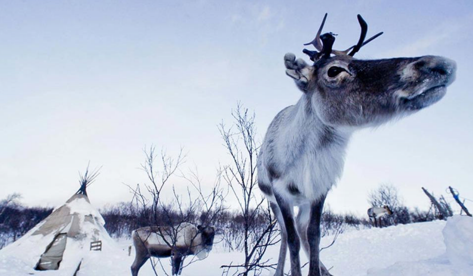
På hovedgaden i Longyearbyen ser I måske Svalbard-rennsdyr, der slentrer forbi

havet og udforske skibets mange faciliteter.