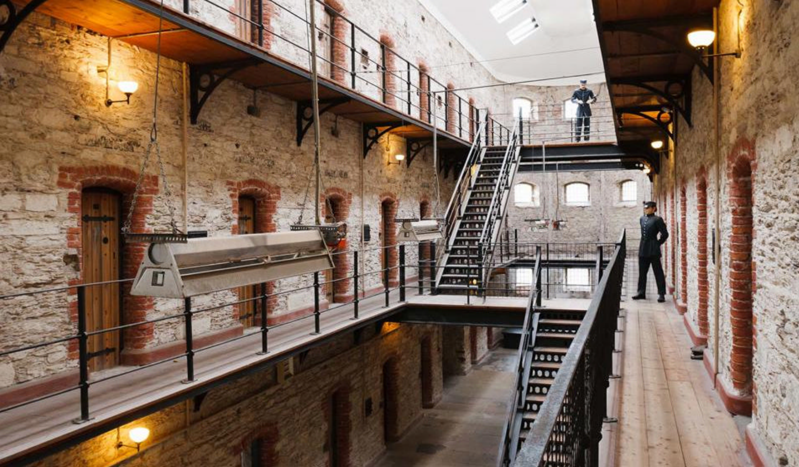
Besøg det gamle fængsel Cork City Gaol

I tager afsked med Belfast kl. 18.00, og i morgen venter det femte land på rejsen, nemlig Skotland.