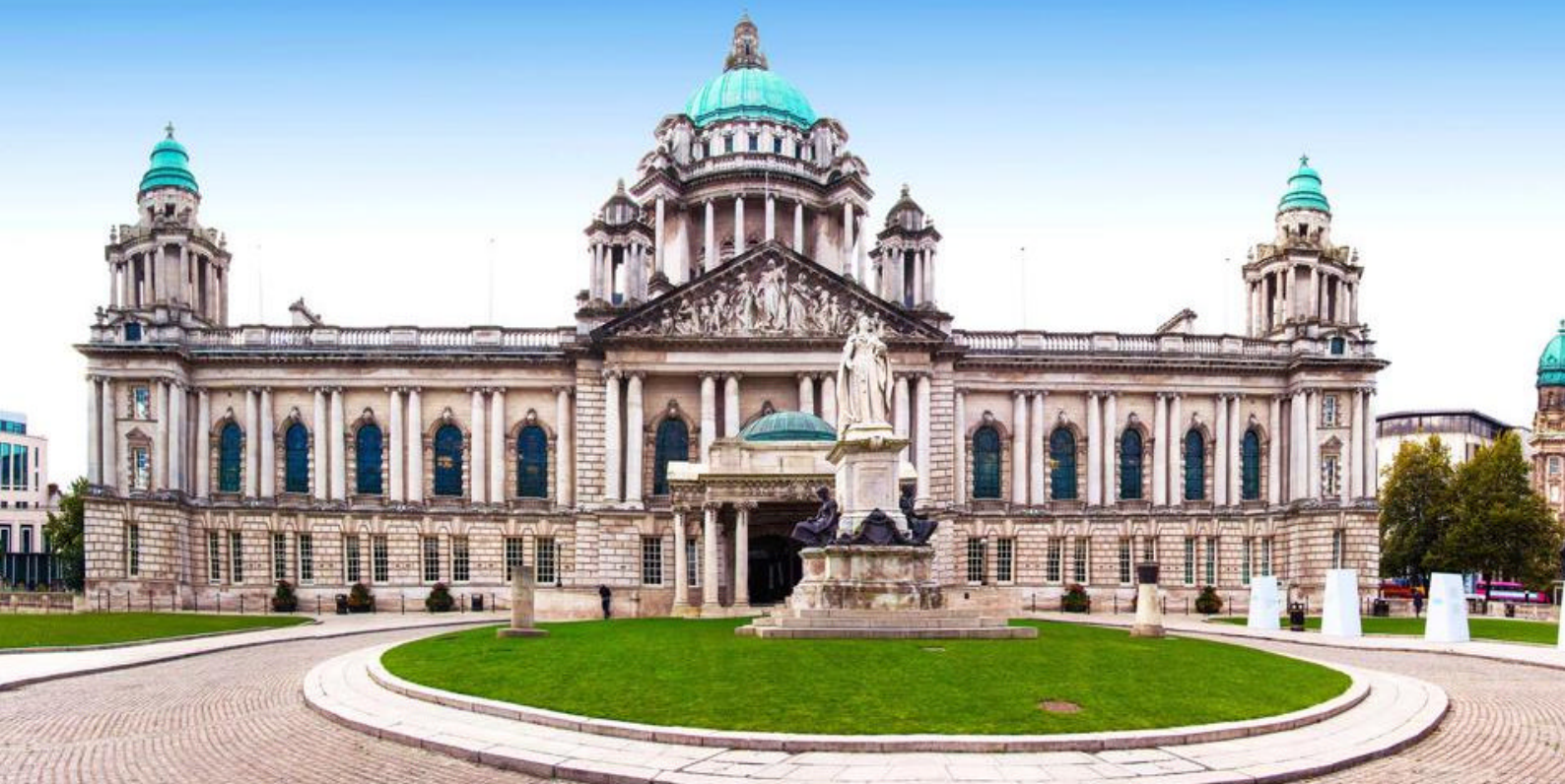
Det smukke rådhus i Belfast

Mulighederne er mange, så tjek skibets udflugter for at få mest muligt ud af dagen.