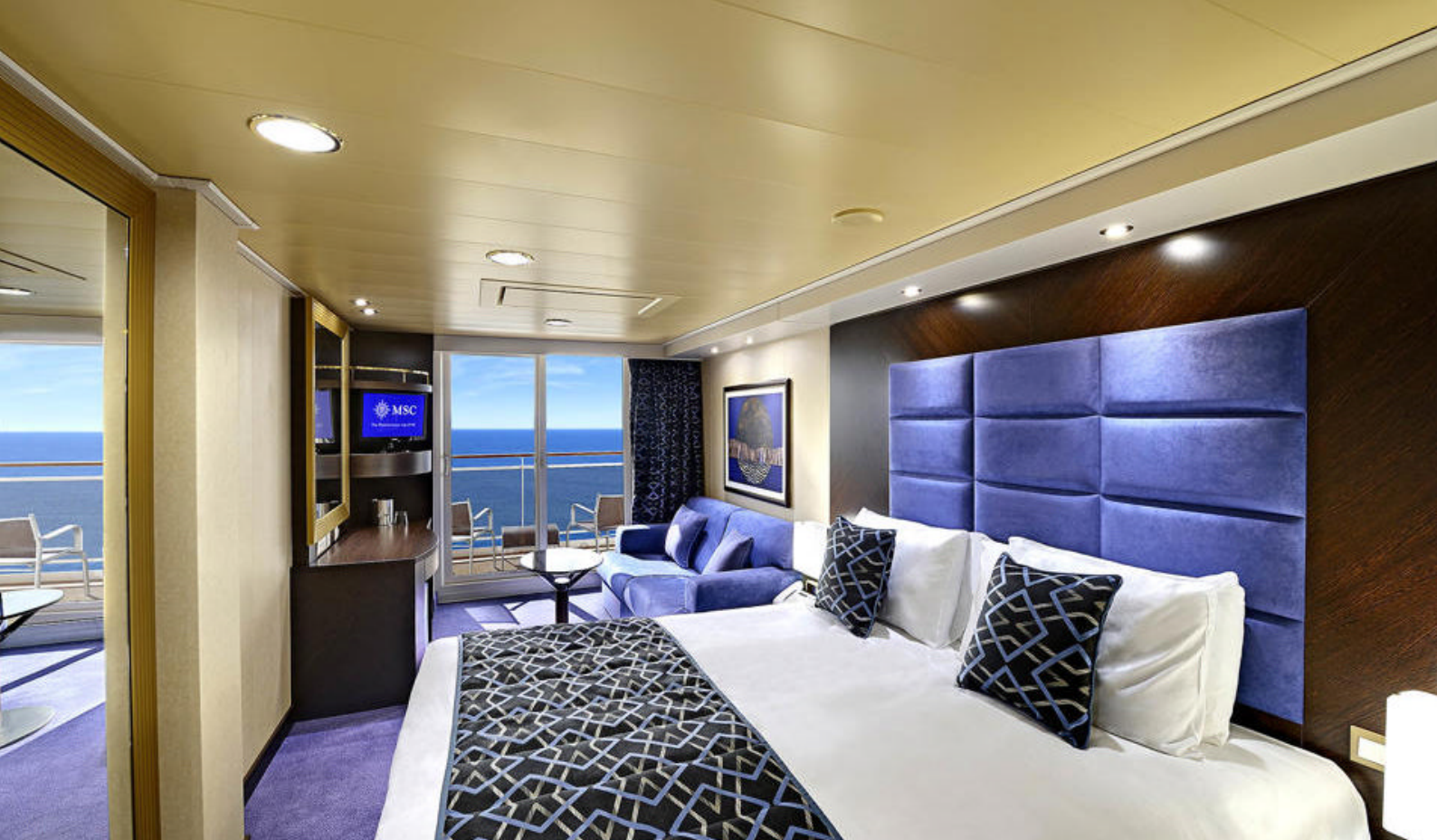
Eksempel på balkonkahyt på MSC Preziosa