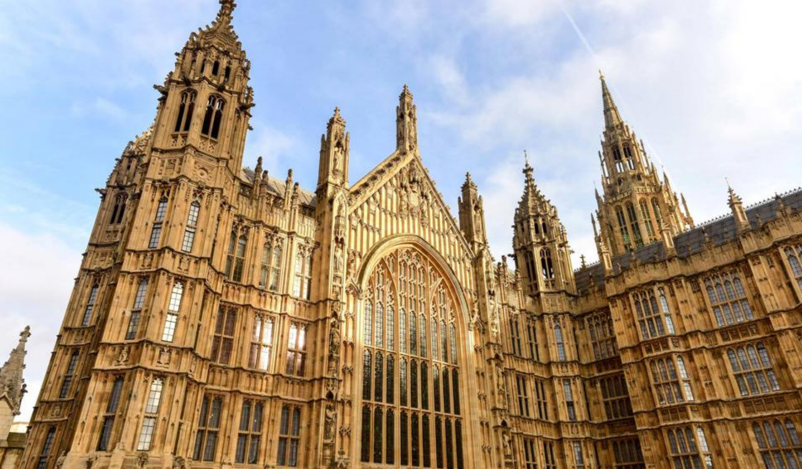
Westminster Abbey i London