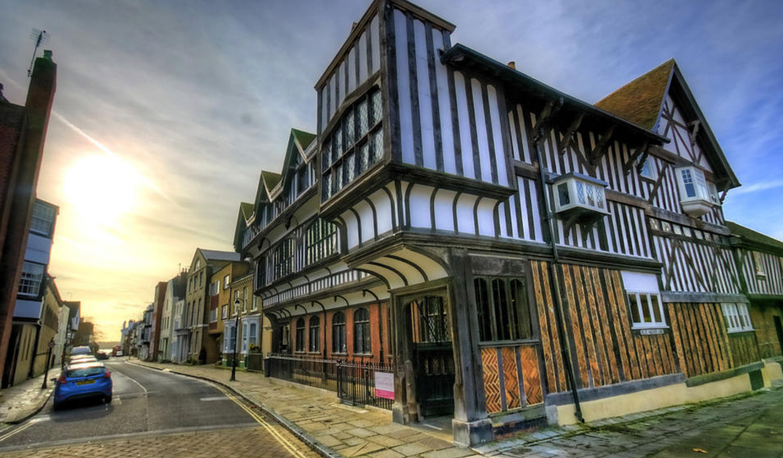
Tudorhuse i Southampton

også blive og udforske Southamptons middelalderhistorie eller blot slappe af på skibet.