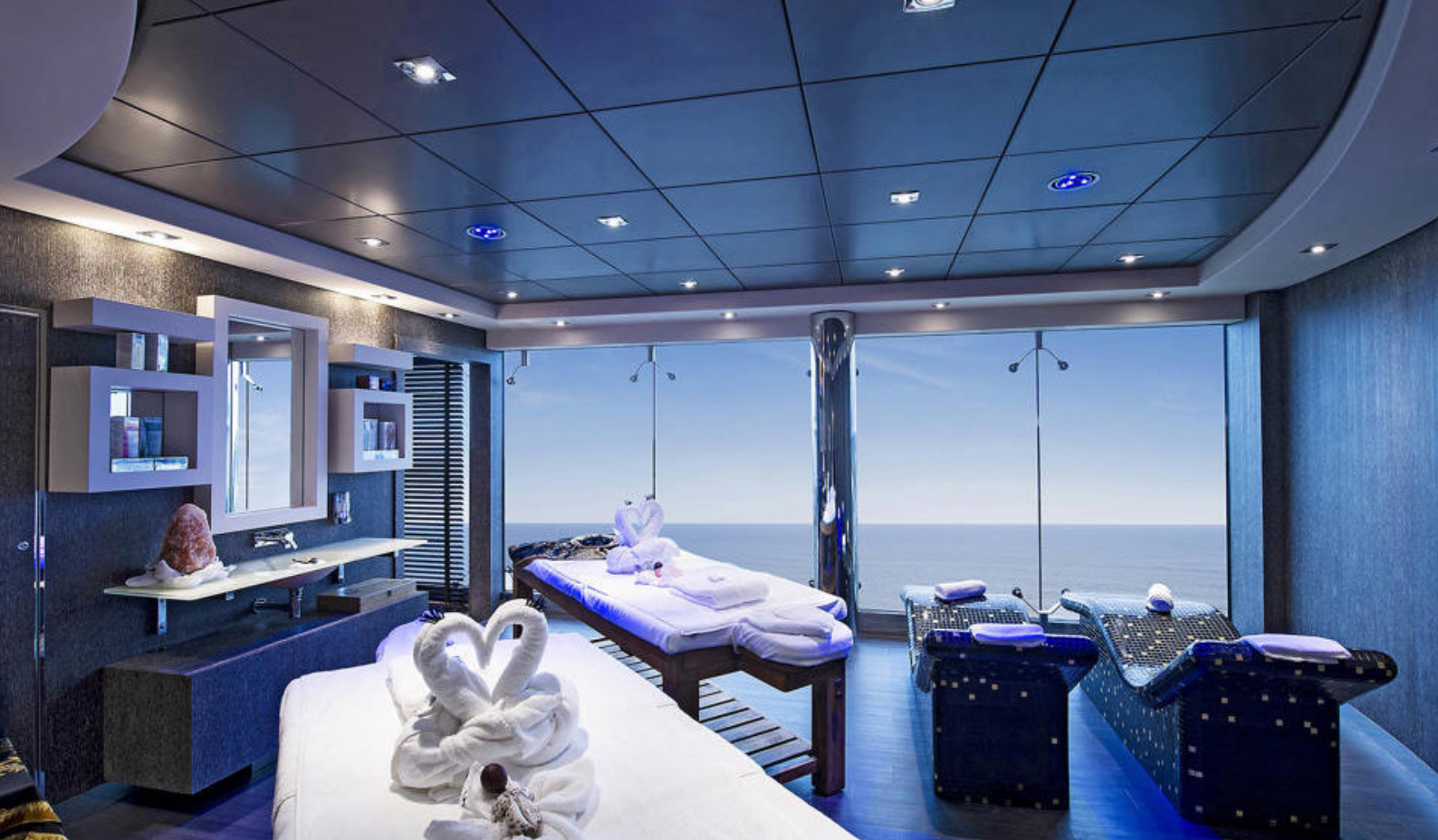
Aurea Spa på MSC Preziosa