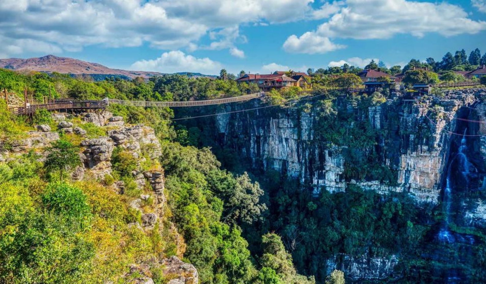
Hængebro over den imponerende kløft ved Graskop Gorge

26.000 ha stort område og et sandt paradys for vilde dyr. Området er en vidunderlig blanding af buskads og græssletter, og Makhutswi-floden slanger sig gennem reservatet og giver liv til såvel planter som dyr. Også dette reservat er hjem for "The Big Five" samt masser af fugle og mindre pattedyr.