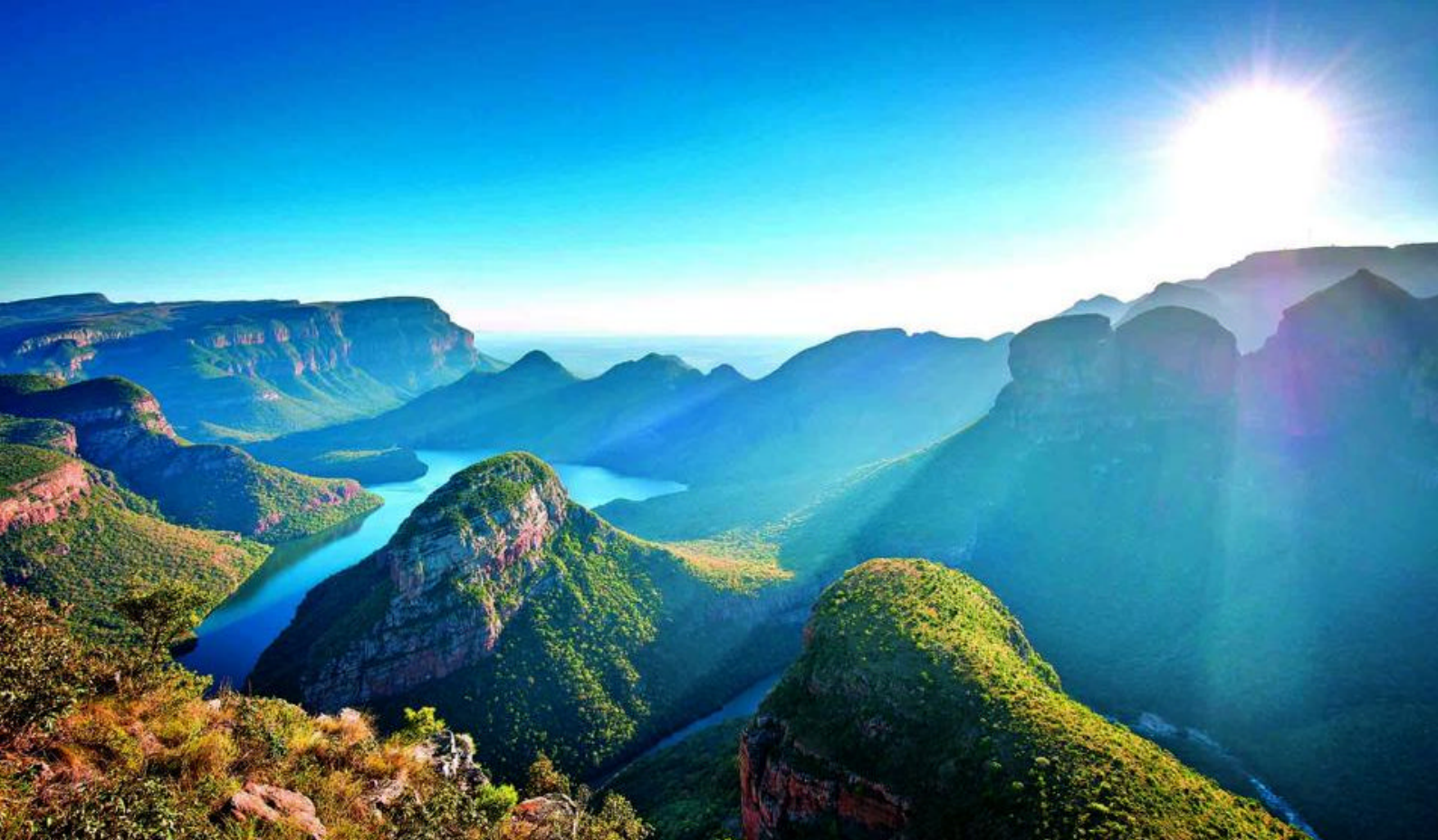
Den smukke Blyde River Canyon - glæd jer til udsigterne fra toppen og fra floden!

Parken er hjem for de fem dyr kendt som "The Big Five": løver, næsehorn, elefanter, leoparder og bøfler. Men Krüger byder på langt mere end det! Forvent farverige fuglearter, antiloper i massevis, elefanter, zebraer, kudu, giraffer og meget, meget mere. Nyd også de fantastiske vidder, som er helt karakteristisk for Afrika.