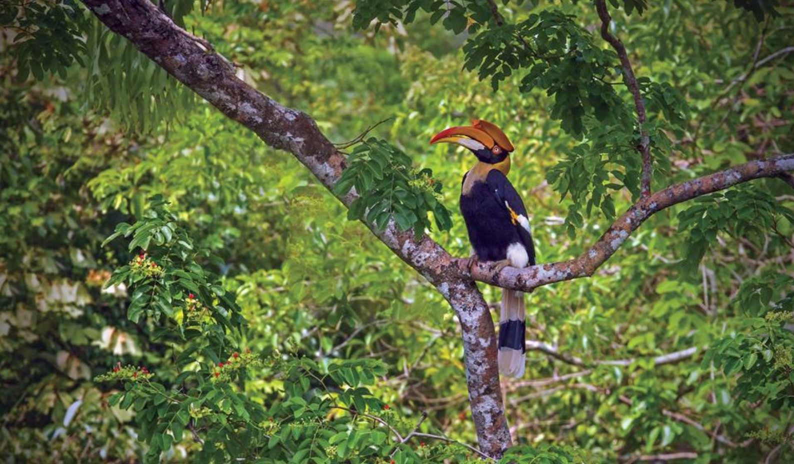
Næsehornsflugl i Khao Sok National Park