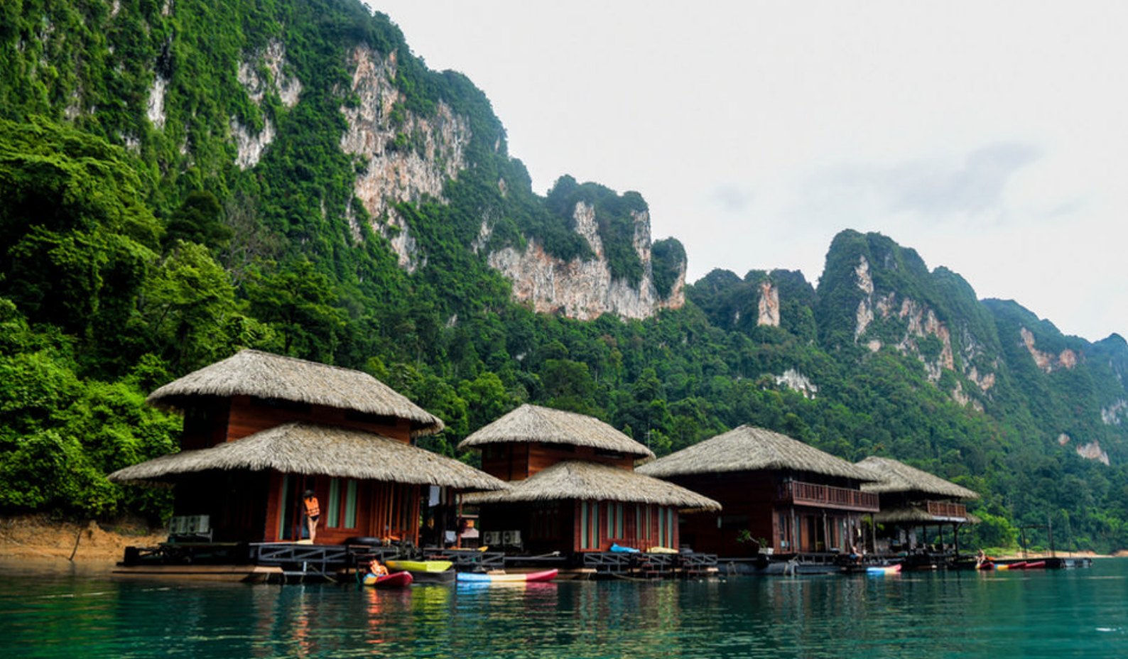
The Greenery Panvaree Floating Resort i Khao Sok National Park

er perfekte til afslapning og at nyde naturen.