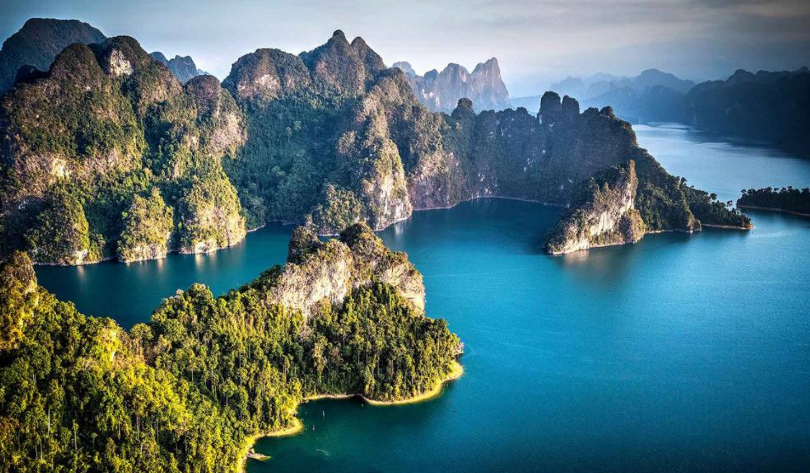
Khao Sok National Park

Måltider inkluderet: Morgenmad på hotellet Overnatning: Khaolak Laguna Resort eller tilsvarende