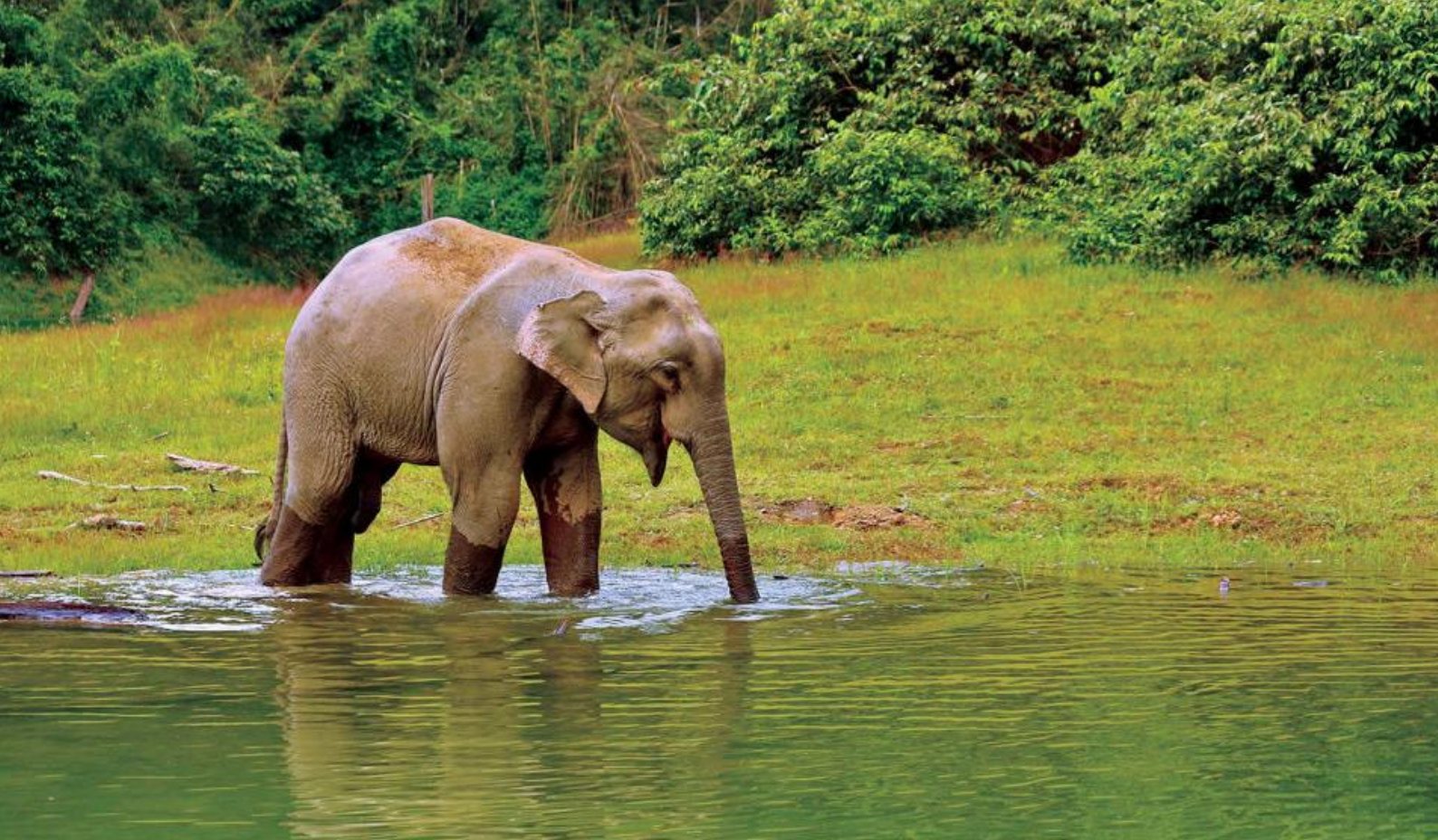
Elefant i Khao Sok National Park