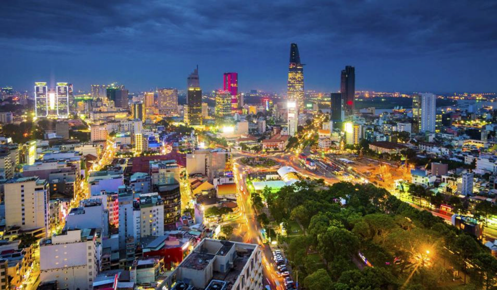
Besøg Ho Chi Minh City i Vietnam, også kendt som Saigon