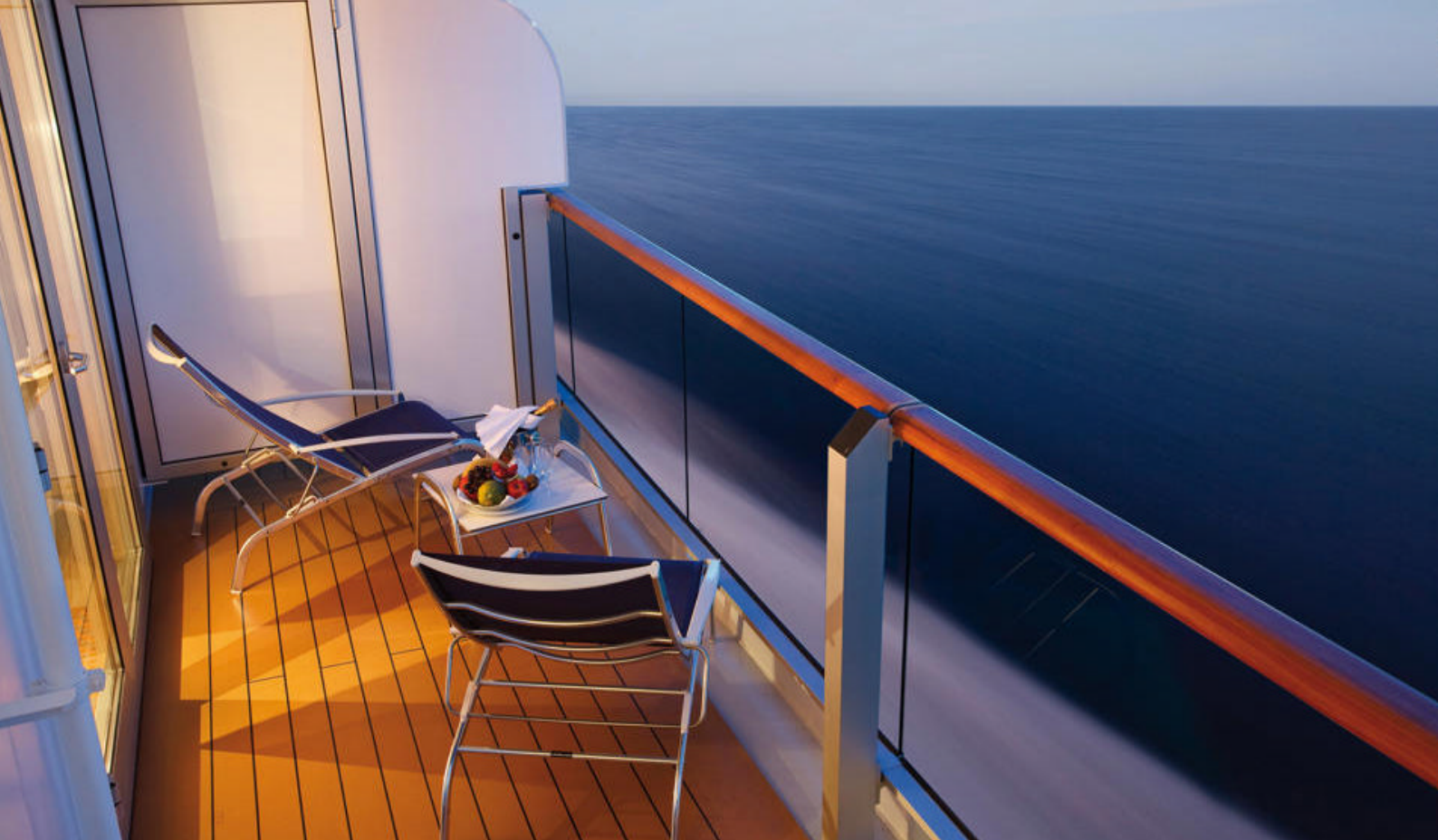
Slap af på egen balkon