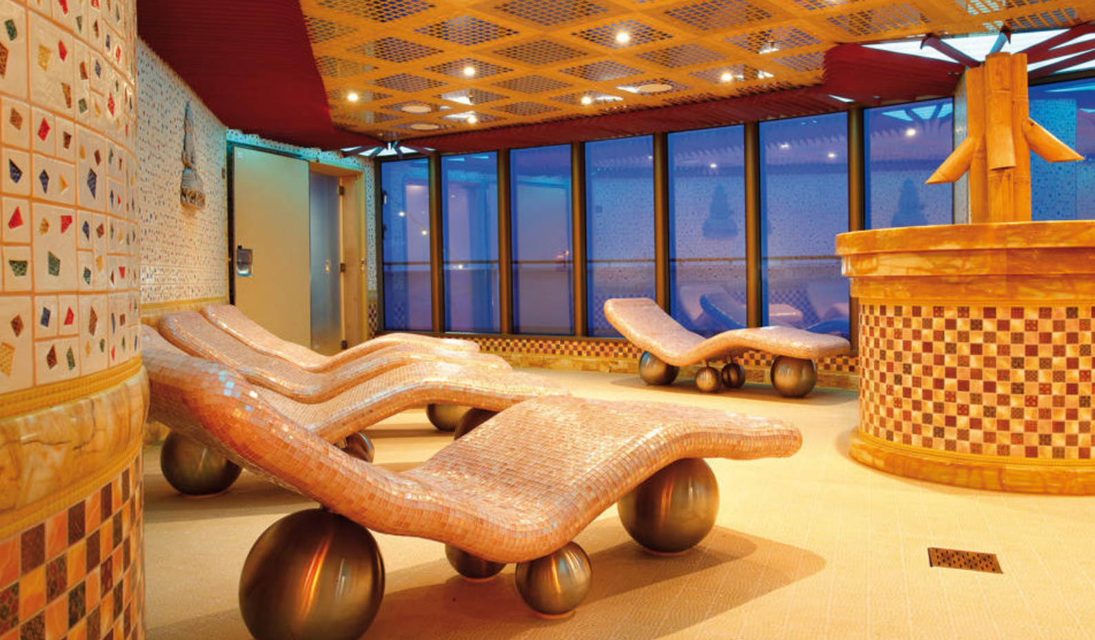
Nyd afslappende dage i spaen ombord på Costa Deliziosa