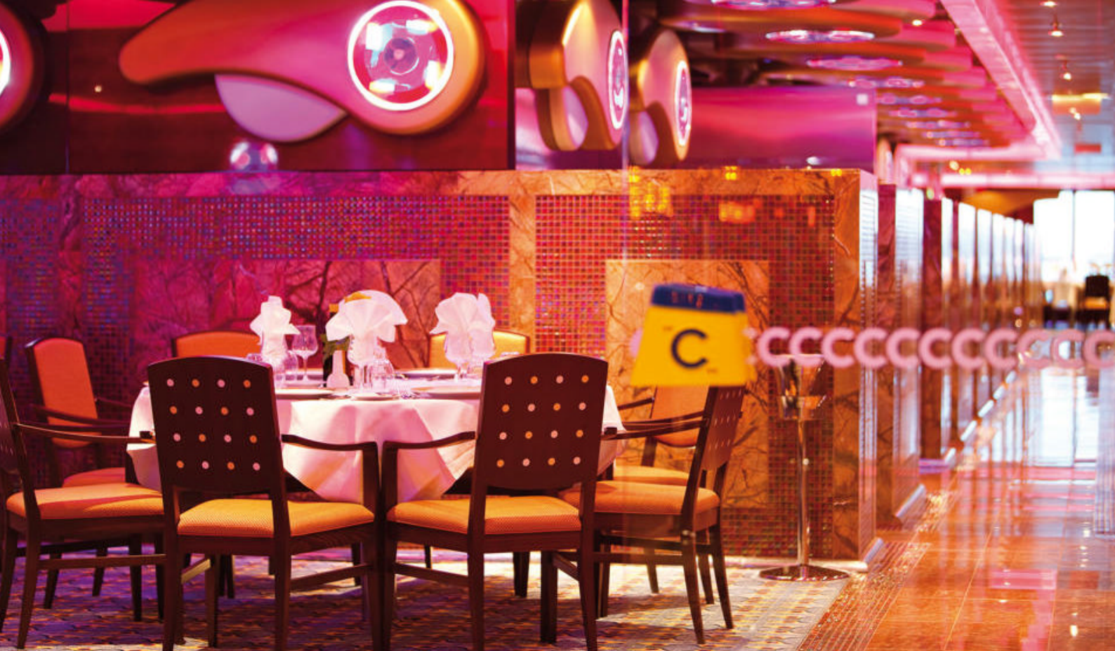
Restaurant ombord på Costa Deliziosa