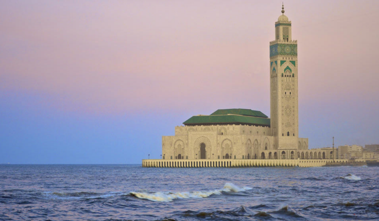
King Hassan II Moskeen, Casablanca

Barcelona er ganske nem at opleve på egen hånd, da byen er meget kompakt med de fleste attraktioner i og omkring pulsåren La Rambla eller blot få minutter væk med det velfungerende, offentlige transportsystem - og her er som sagt nok at tage sig til: