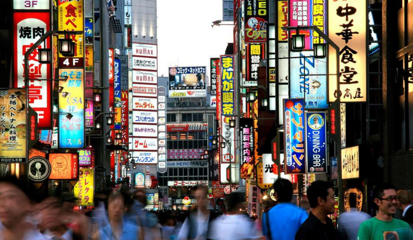
Oplev stemningen i Tokyo, Japan

havn. Det kommunale marked i centrum, Le Marché, er et spændende sted at købe alt, hvad Tahiti har at byde på inklusive vaniljebønner, monoi olie og farverige pareos (saronger). For at leve som en lokal, tag da turen til Vai'ete pladsen efter solnedgang. Denne strandpromenade kommer til liv om natten, når gourmet foodtrucks, Les Roulottes, åbner vinduerne for at servere en lang række forskelligartede måltider: Kinesisk mad, franske crêpes, frisk fisk og pizza.