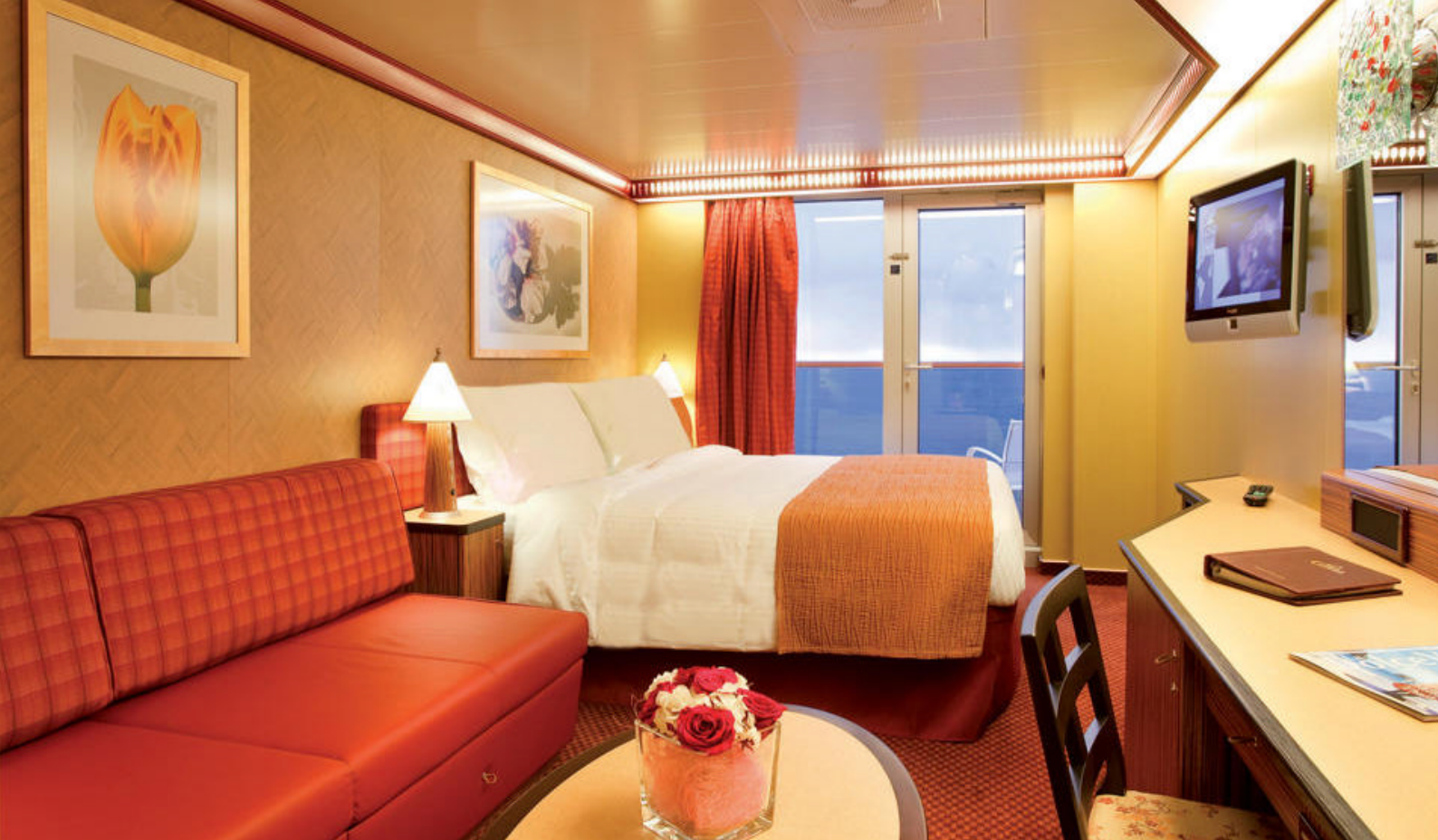
Eksempel på balkonkahyt på Costa Deliziosa

sidste 40 år med moderne skyskrabere, som skyder i vejret overalt til enhver tid. Landet er i dag Sydøstasiens ledende finanscenter.