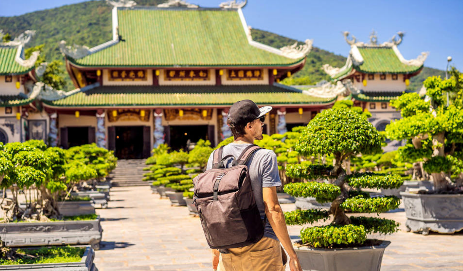
Linh Ung-templet i Da Nang, Vietnam

De fødevarer, der traditionelt set indgår i det lokale køkken på øen, er typisk fisk, kokosnød, banan, taro, søde kartofler og yams. Den franske indflydelse fornægter sig ikke, hvilket ses tydeligst på udbredelsen af fremragende kaffe.