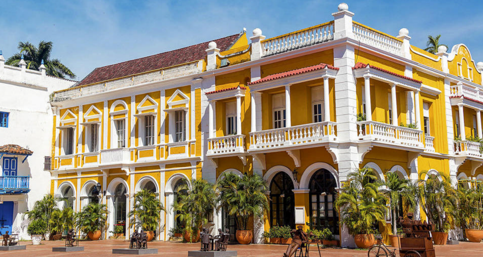
Cartagenas smukke spanske koloniarv

Det anbefales, at I tjekker rederiets udflugtsprogram for mere information.