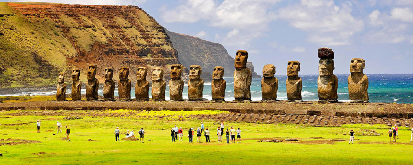
Unikt besøg på Påskeøen

tiltrækker sig opmærksomheden under besøget. Området er optaget på UNESCOs kulturarvsliste siden 1988 på grund af sin enestående universelle værdi og autenticitet. Lima var spaniernes vigtigste by i Sydamerika og spillede en væsentlig rolle i udbygningen af spaniernes indflydelse og dominans i Den Ny Verden. Da spanierne grundlagde vicekongedømmerne 'New Granada' (nuværende Colombia og Venezuela) og 'La Plata' (del af det nuværende Chile og Argentina) i 1700-tallet faldede Limas betydning.