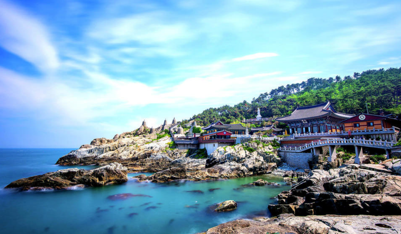
Haedong Yonggungsa Templet, Busan