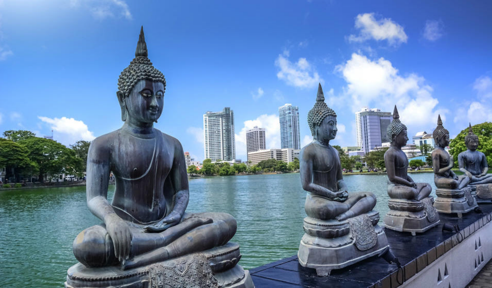
Buddhaer i Colombo, Sri Lanka