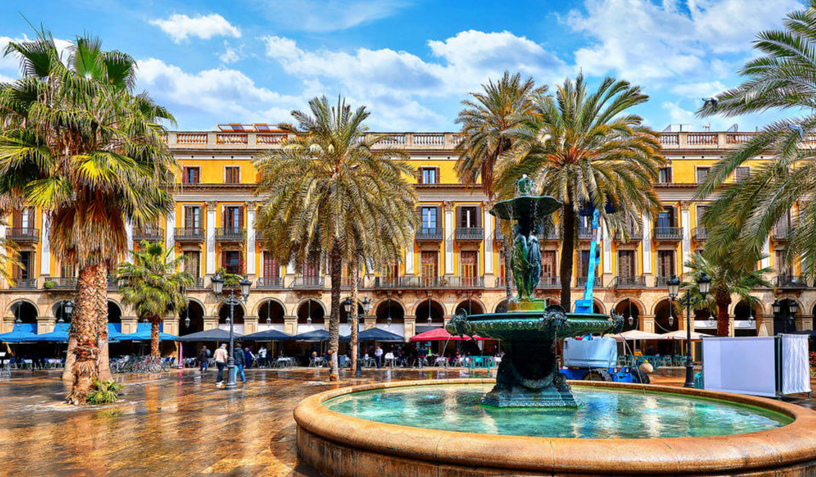
Smukke Placa Reial i Barcelona