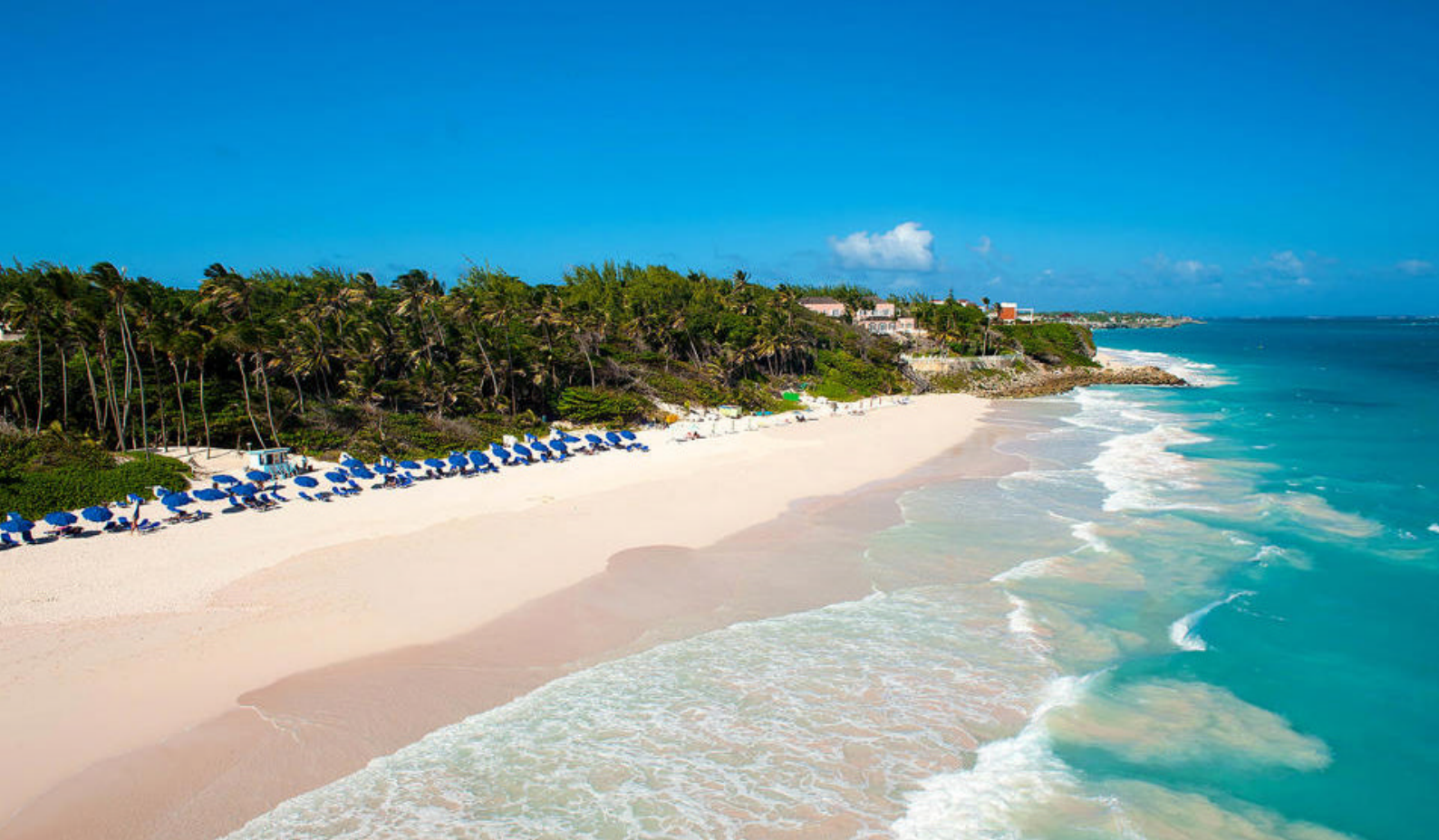
Crane Beach på Barbados

Sidst men ikke mindst må man ikke glemme Tenerifes største seværdighed, vulkanen Teide og den tilhørende nationalpark med mageløs, unik natur.