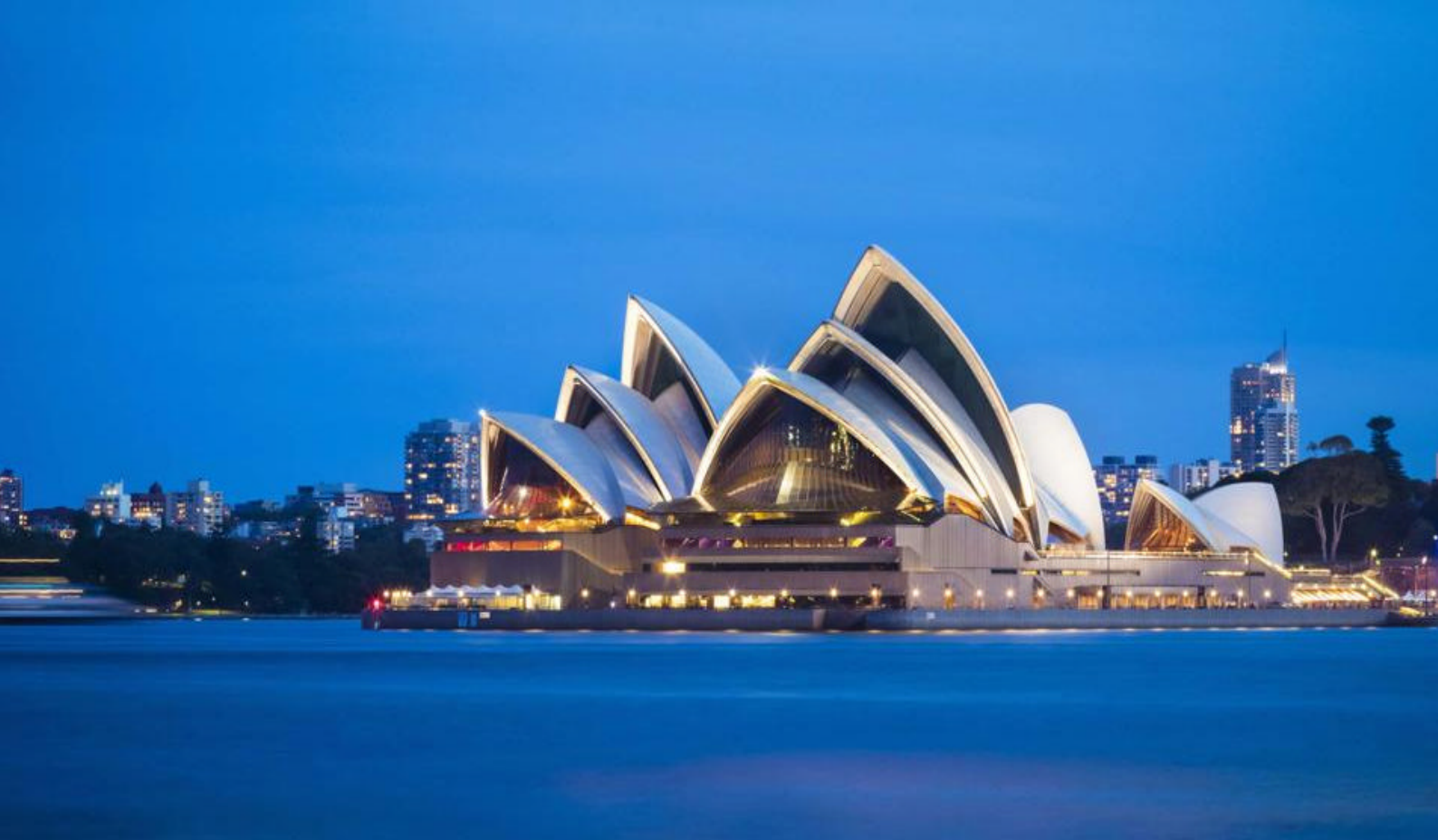
Sydneys ikoniske Operahus

Valparaiso ligger direkte ud til Stillehavet og vejen dertil er meget smuk med vinmarker og charmerende gårde med de sneklædte Andesbjerge i baggrunden. Byen er af mange benævnt 'Stillehavets perle', især på grund af det smukke, gamle og historiske havnekvart, som er optaget på UNESCOs kulturarvsliste. Byen er et excellent eksempel på den urbane og arkitektoniske udvikling i Sydamerika i slutningen af 1800-tallet.