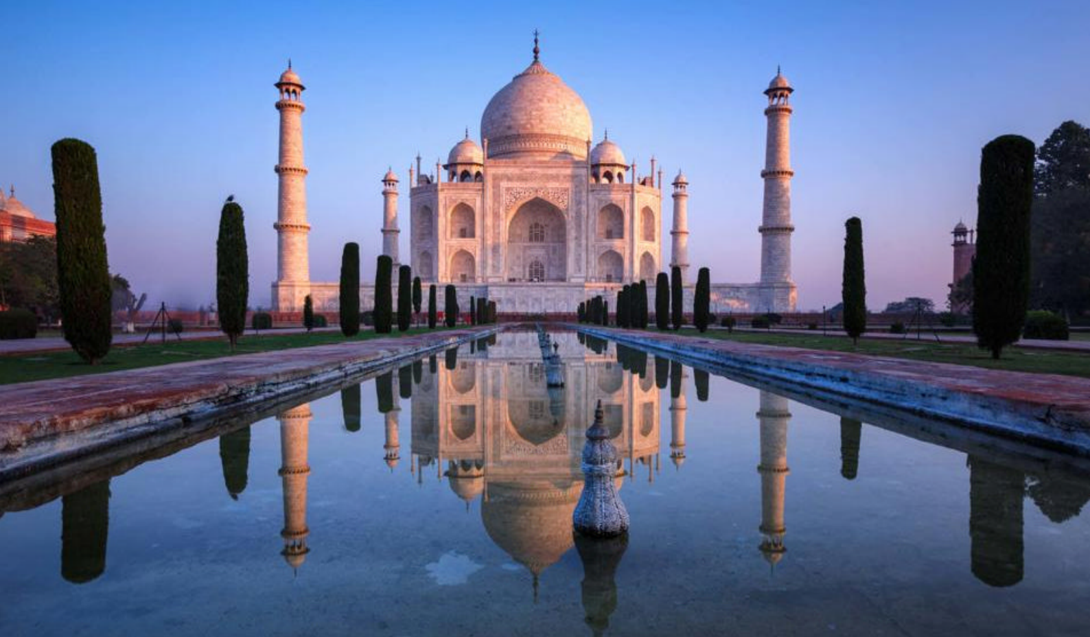
Besøg Taj Mahal i Mumbai, Indien