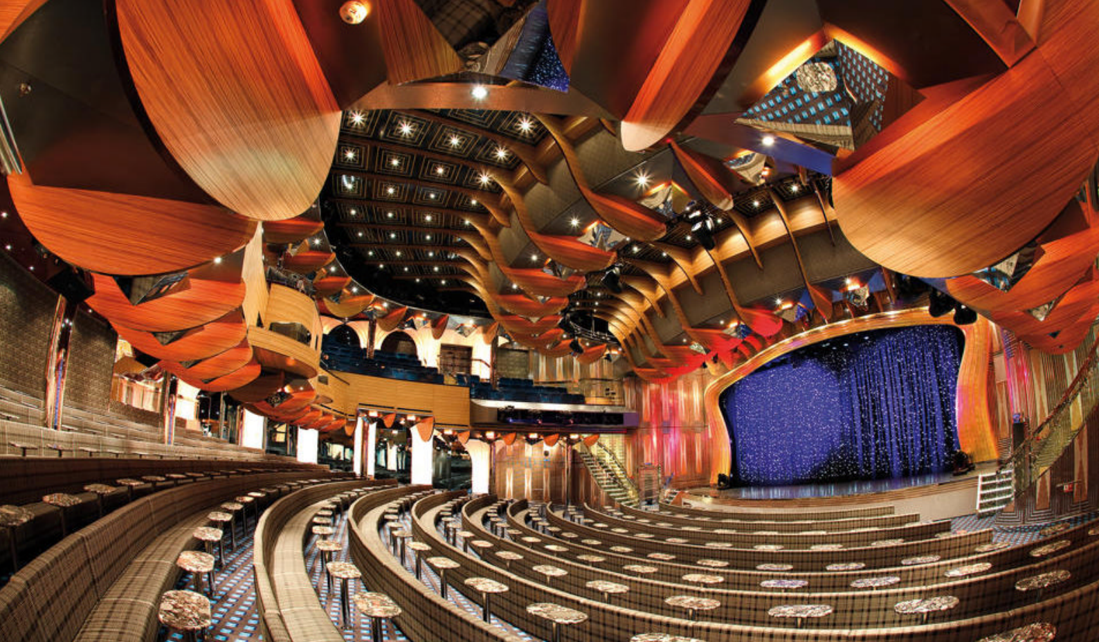
Om aftenen er der underholdning i skibets teater