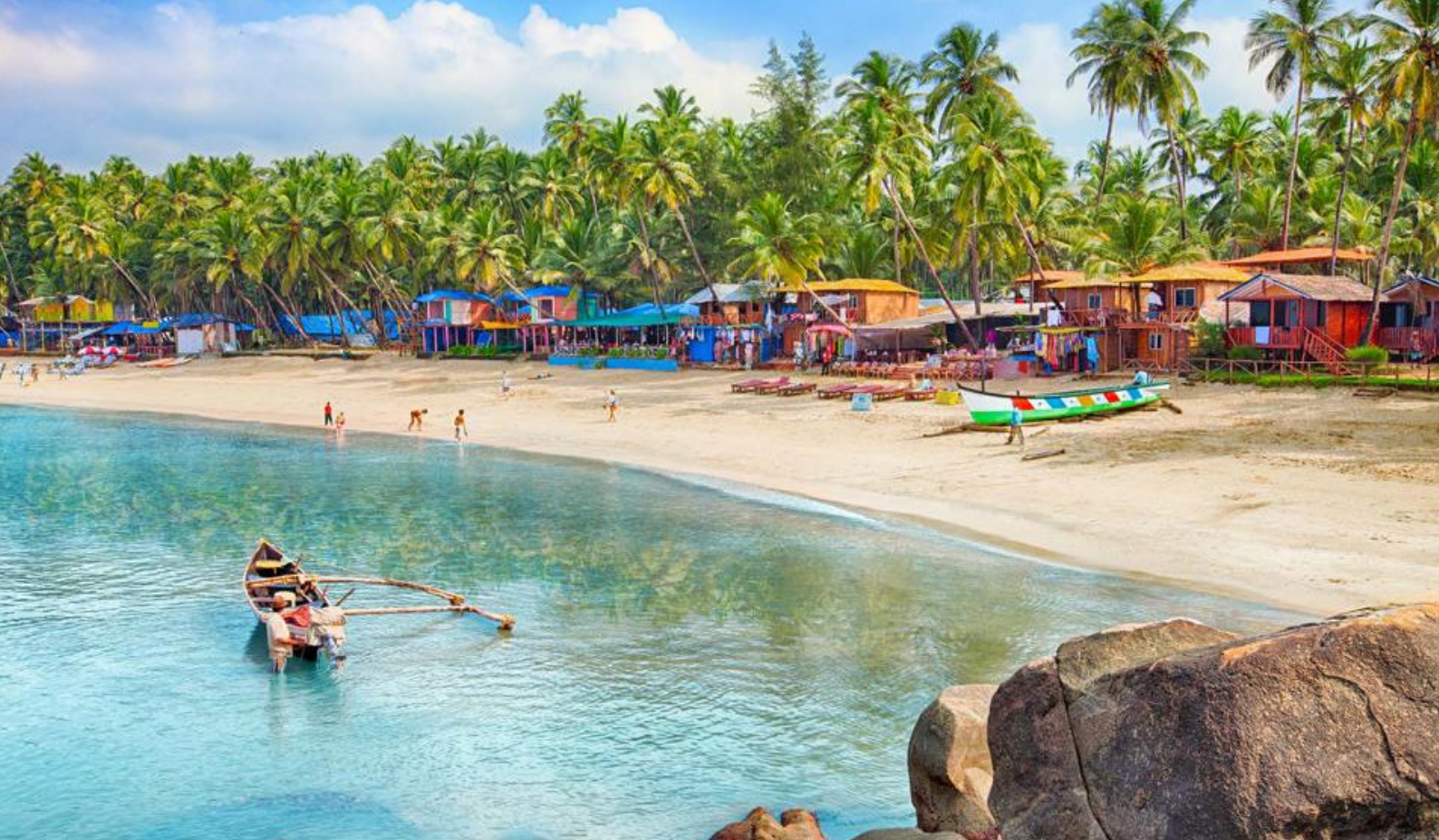
Paradisiske Goa, Indien