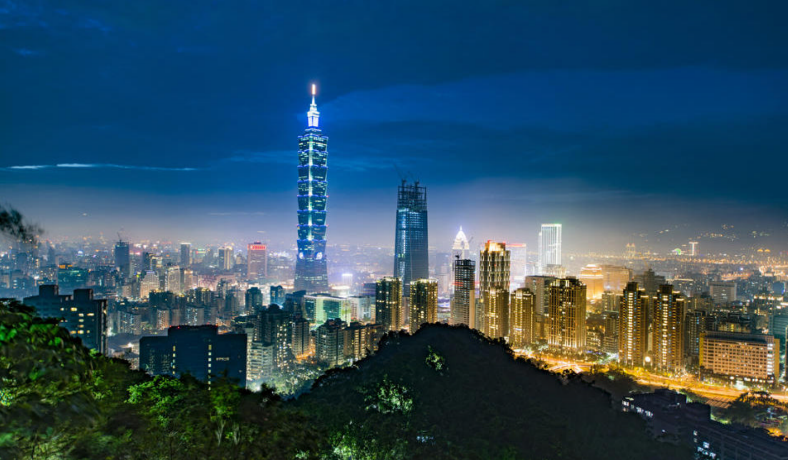
Spændende Taipei, Taiwan

udrydningstruede planter og dyr. Den subtropiske regnskov har flere stier, der leder til smukke vandfald.