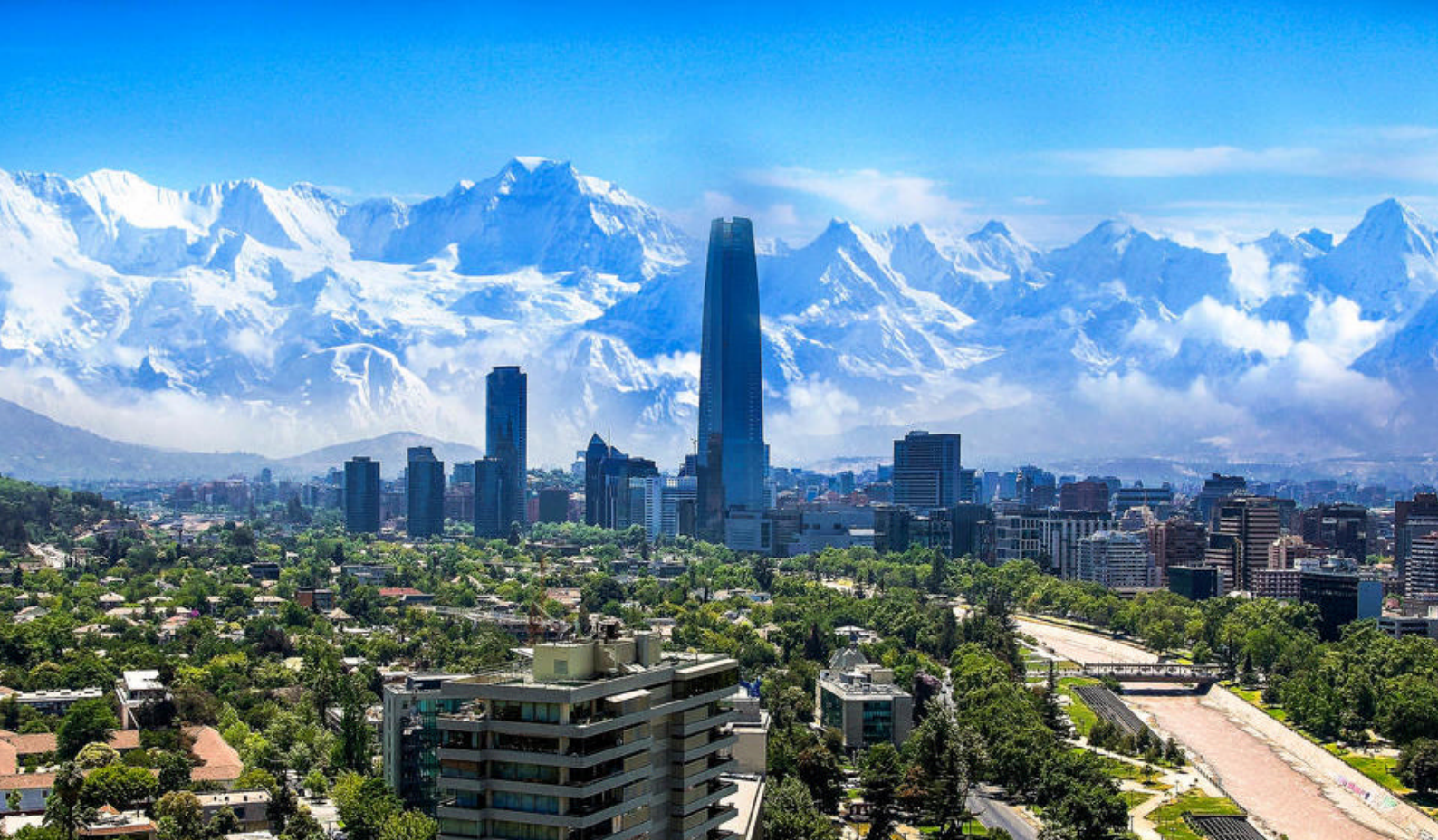
Chiles smukke hovedstad, Santiago med blændende beliggenhed

lægge til her. Det skyldes den lille by Montecristi, der ligger ca. 15 km oppe i baglandet bag Manta. Montecristi blev grundlagt af flygtede indbyggere fra Manta i årene 1536-37. Byens navn siges at stamme fra en af de første bosættere, der bar navnet Criste, og som byggede et hus på toppen af bjerget. Heraf navnet Montecriste, som senere er ændret til Montecristi.