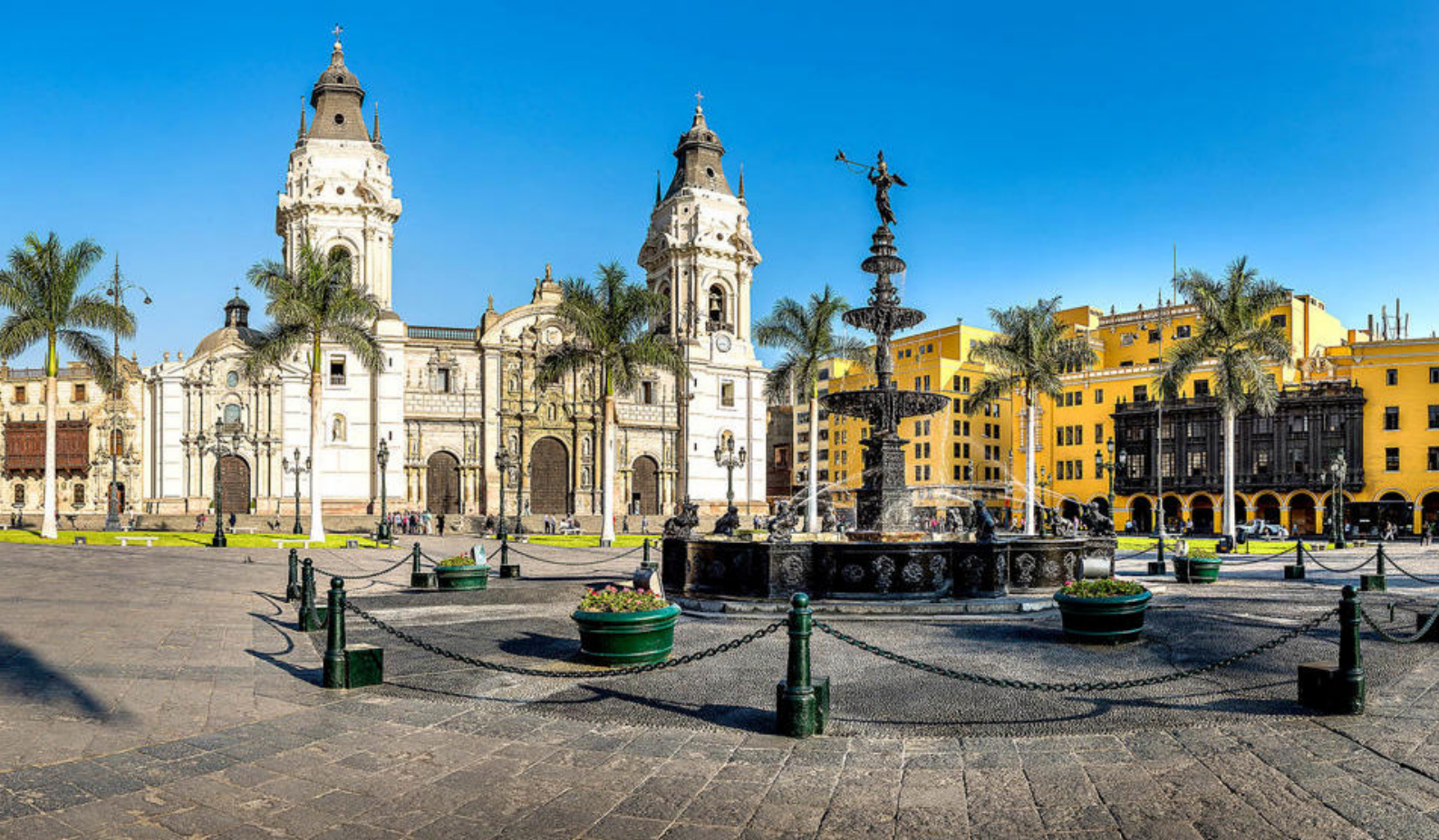
Plaza Mayor i Lima

Måltider inkluderet: Helpension Overnatning: Costa Deliziosa