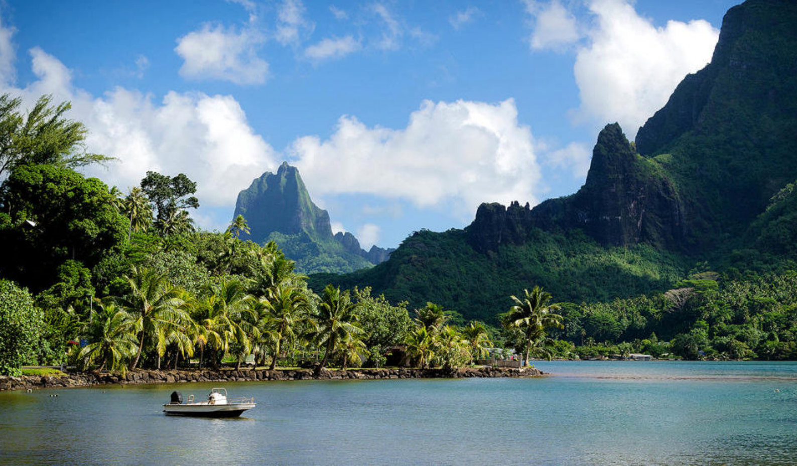
Tahiti i Fransk Polynesien