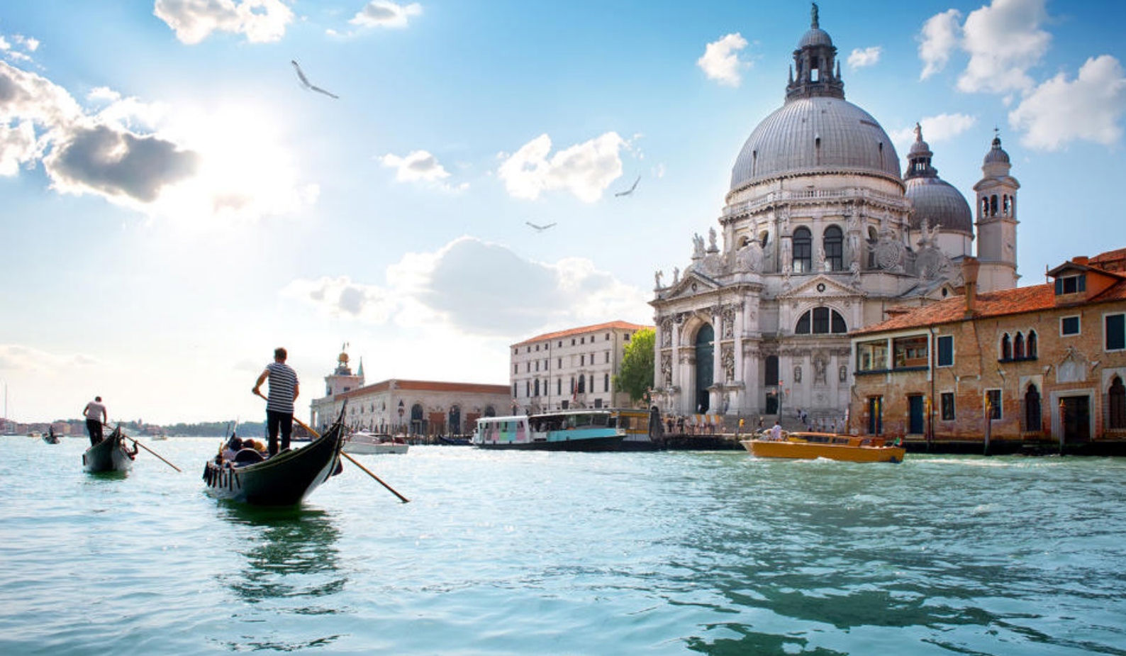
Turen starter i fantastiske Venedig i Italien