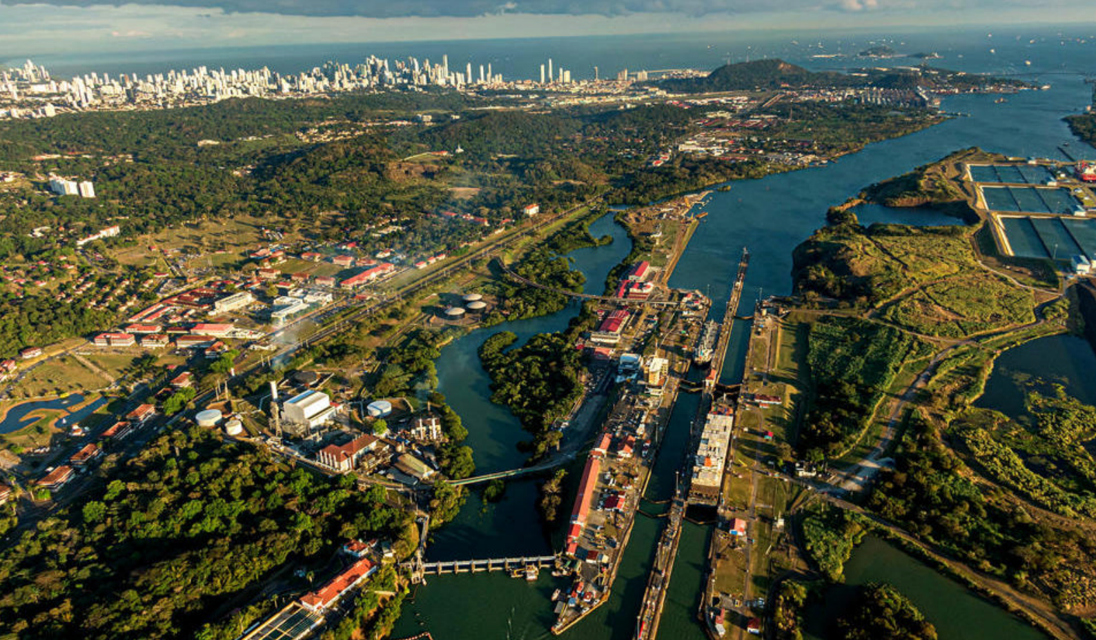
Sejlds gennem Panamakanalen