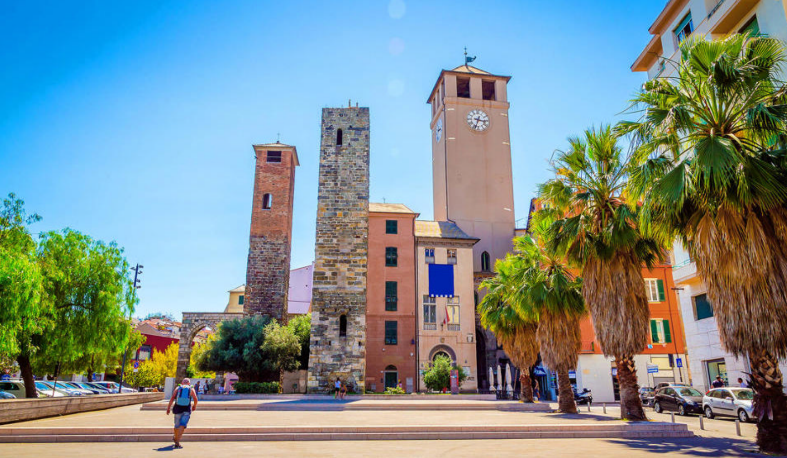
Smukke Savona i det nordlige Italien

Langs de endeløse brostensgader finder man hyggelige caféer og pizzeriaer, hvor end man går. Når det gælder mad, så er der en ting I absolut må prøve, mens I er her i dag: Pizza! Napoli er kendt for at være pizzaens hjemby, og I bør i hvert fald prøve den klassiske pizza Margherita med lokale ingredienser og ferske råvarer - et must for enhver pizzaelsker.