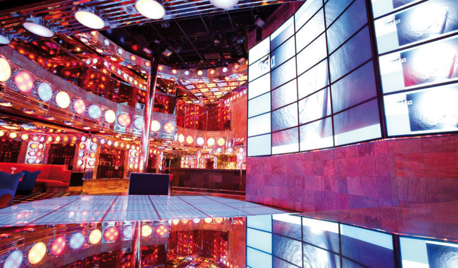
Diskotek ombord på fantastiske Costa Deliziosa