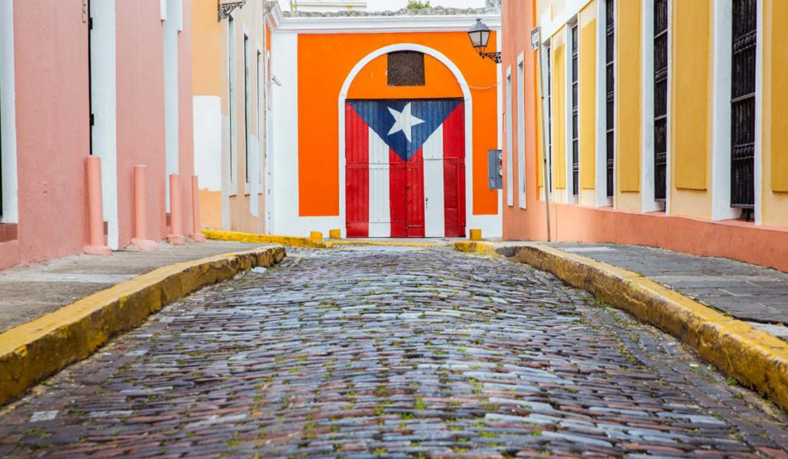
Farverige San Juan, Puerto Rico

Måltider inkluderet: Helpension på skibet Overnatning: Symphony of the Seas