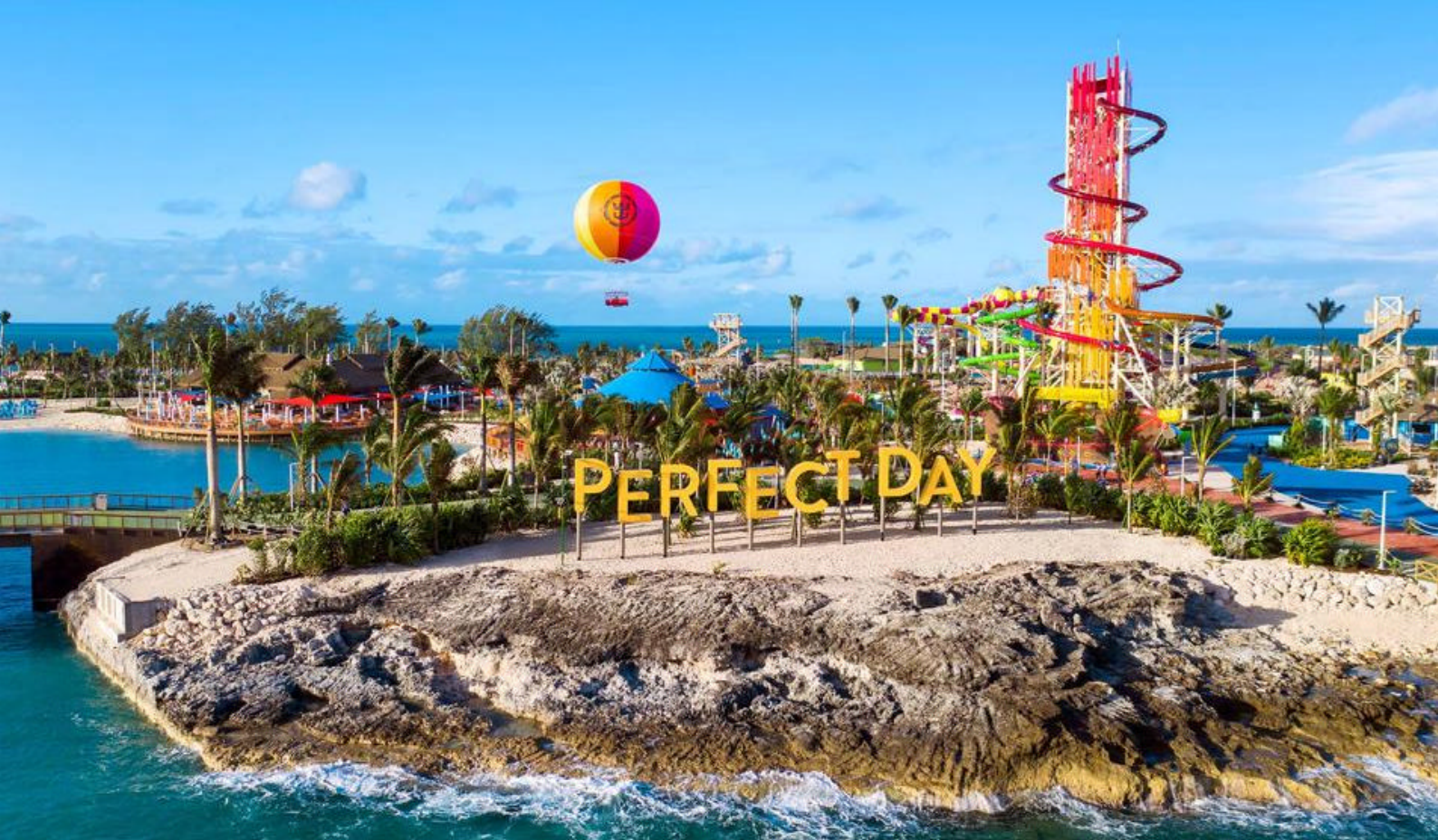
Sejladsen starter med en Perfect Day at CocoCay i Bahamas

Oasis Lagoon er det største ferskvandsbassin i Caribien, hvor I kan svømme, flyde i en badebåd eller slappe af i en poolbar med forfriskende cocktails. South Beach er et afsondret område perfekt til roligere strandtid med masser af plads til at slappe af og nyde øens naturskønhed.