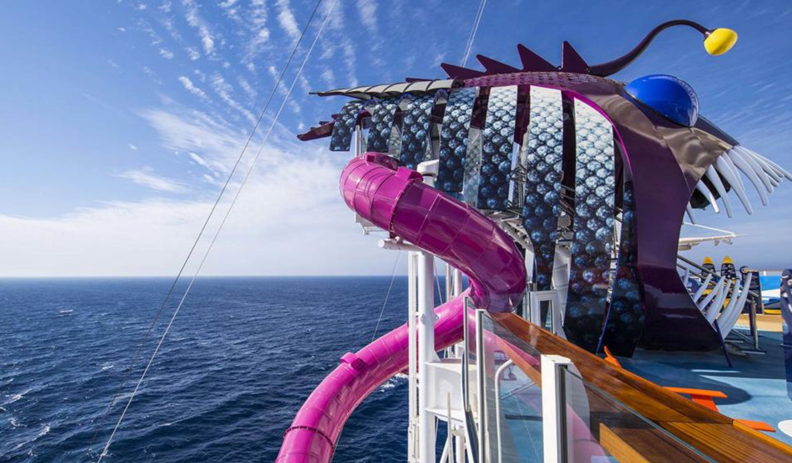
Vandrutchebane på Symphony of the Seas