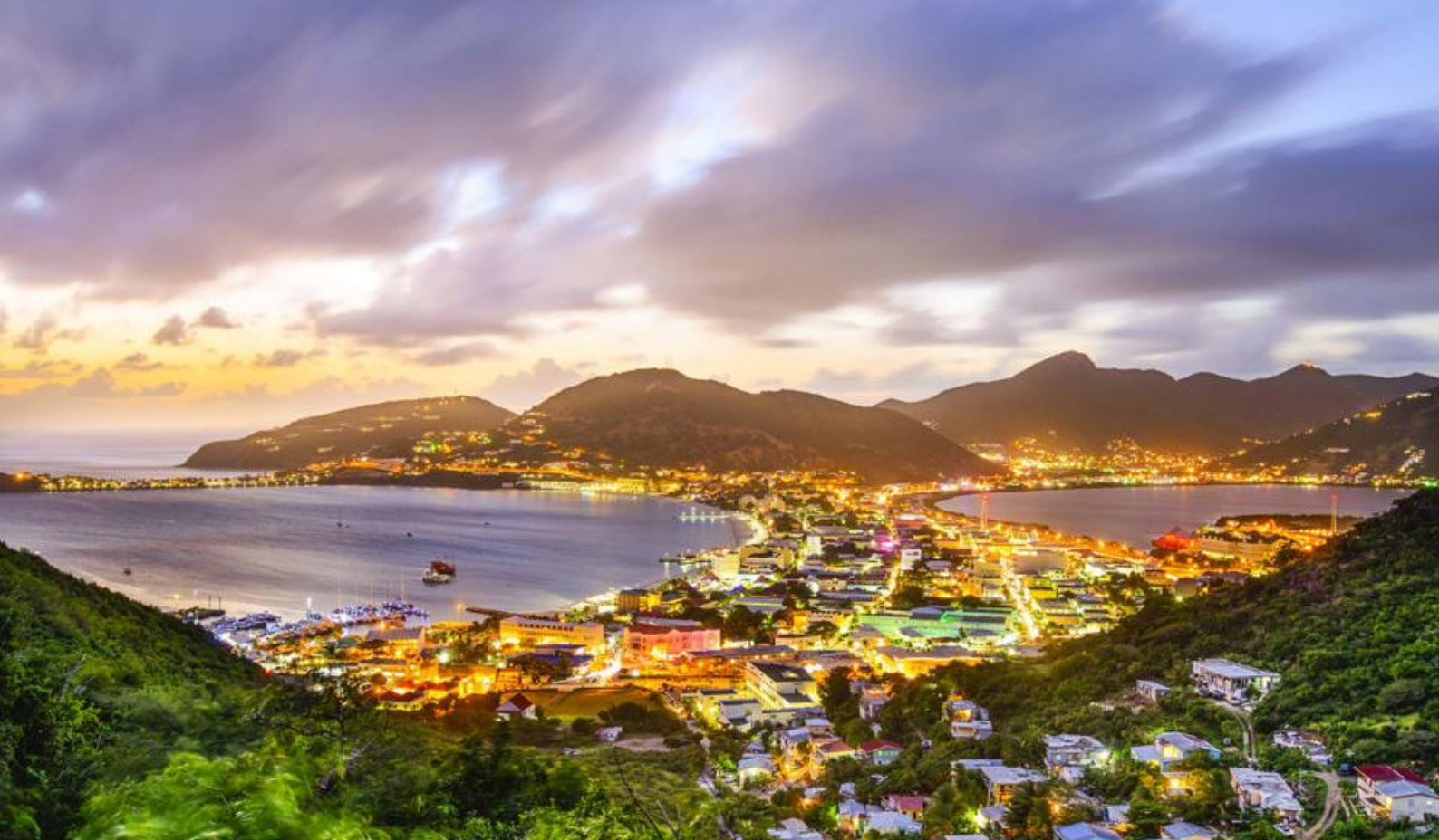
Smukke Philipsburg, St. Maarten

butikker, restauranter og caféer og er et fantastisk sted at udforske den lokale kultur og prøve autentisk caribisk mad. Gå langs brostensbelagte gader og lad jer friste af farverige souvenirbutikker og lokale kunstværker.