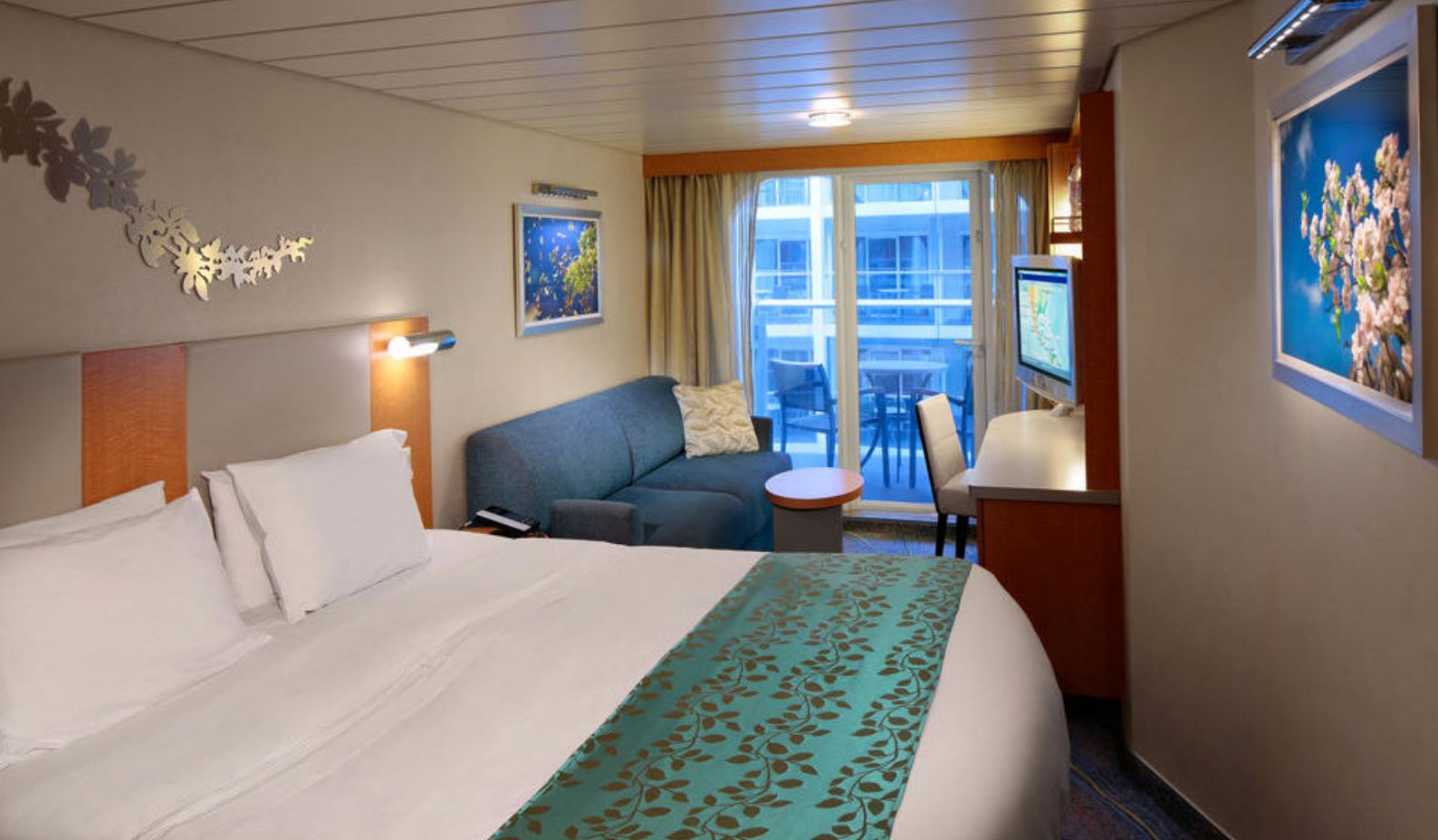
Eksempel på balkonkahyt på Symphony of the Seas

South Beach (Miami Beach) er en af Miamis mest ikoniske destinationer, kendt for sine smukke strande, art deco-arkitektur og livlige atmosfære. Nyd solen, slentr langs Ocean Drive og beundr de farverige bygninger og livlige caféer. Udforsk det berømte historiske distrikt i South Beach, der er fyldt med smukt bevarede art deco-bygninger, der fremviser en unik arkitektonisk stil fra 1920'erne og 1930'erne.