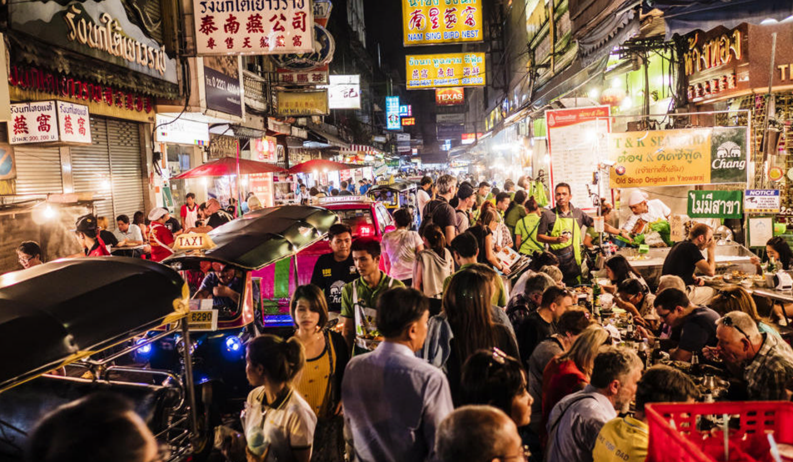
Street food i Bangkok

I skal her besøge et unikt jernbanemarked, hvor de lokale sælger forskellige varer fra deres boder, som de sætter op langs jernbanesporet. Herefter fortsætter rejsen til det berømte flydende marked, Damnoen Saduak. Selvom markedet i dag tiltrækker mange turister, giver det stadig det bedste indblik i, hvordan et flydende marked så ud for årtier siden.