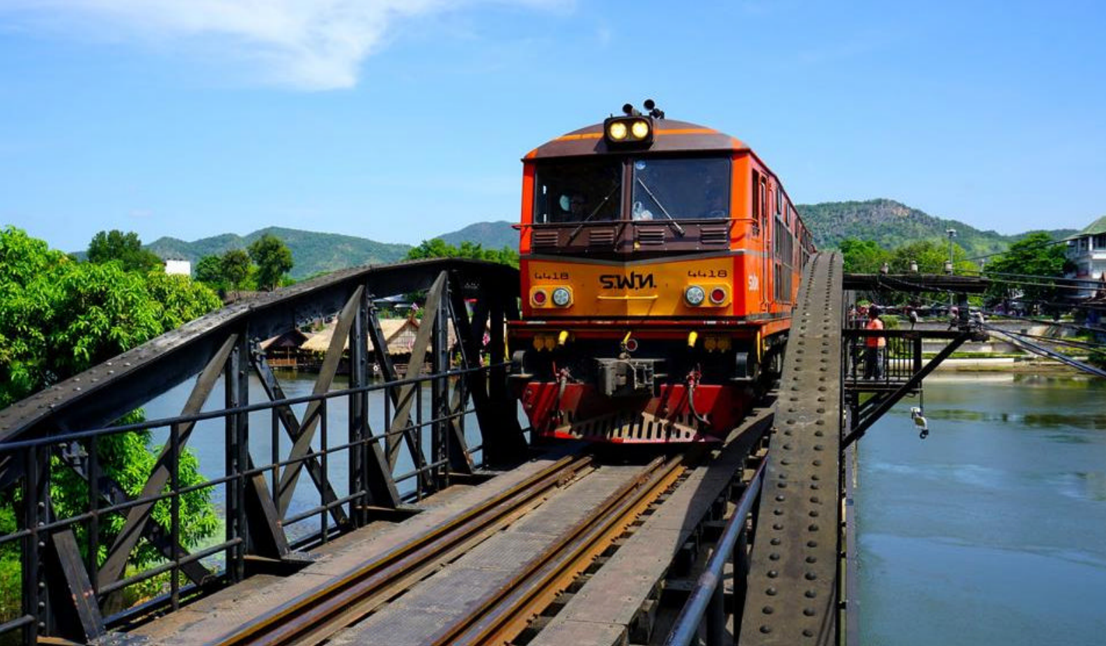
Broen over floden Kwai

bil til Talen Pier i Krabi, hvorfra I sejler med speedbåd til jeres hotel, som I ankommer til midt på eftermiddagen.