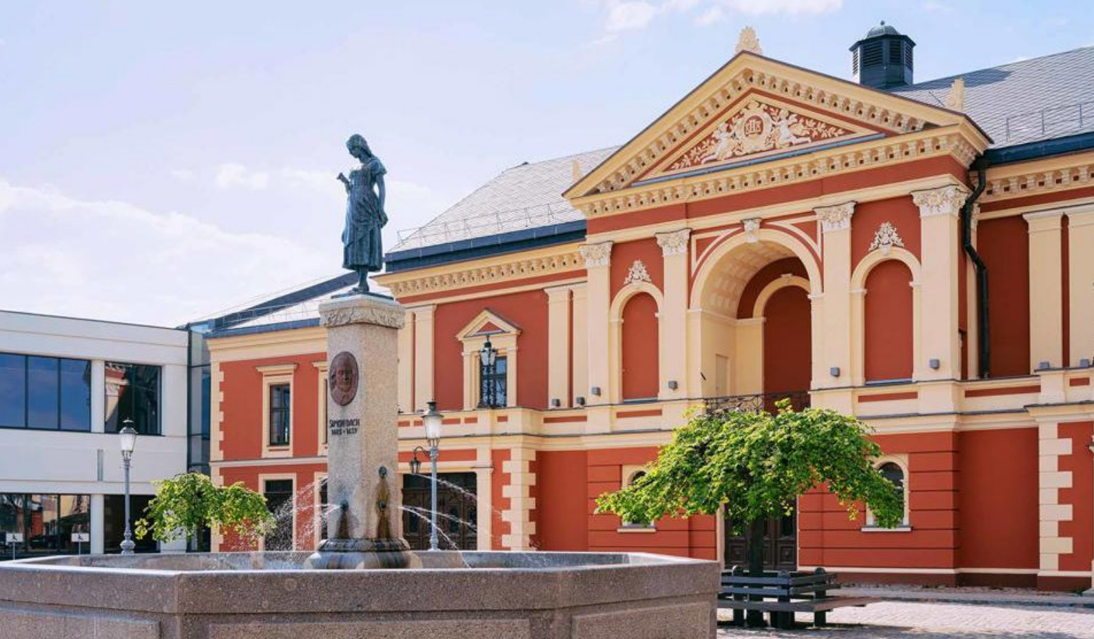
Den gamle bydel i Klaipedia, Litauen