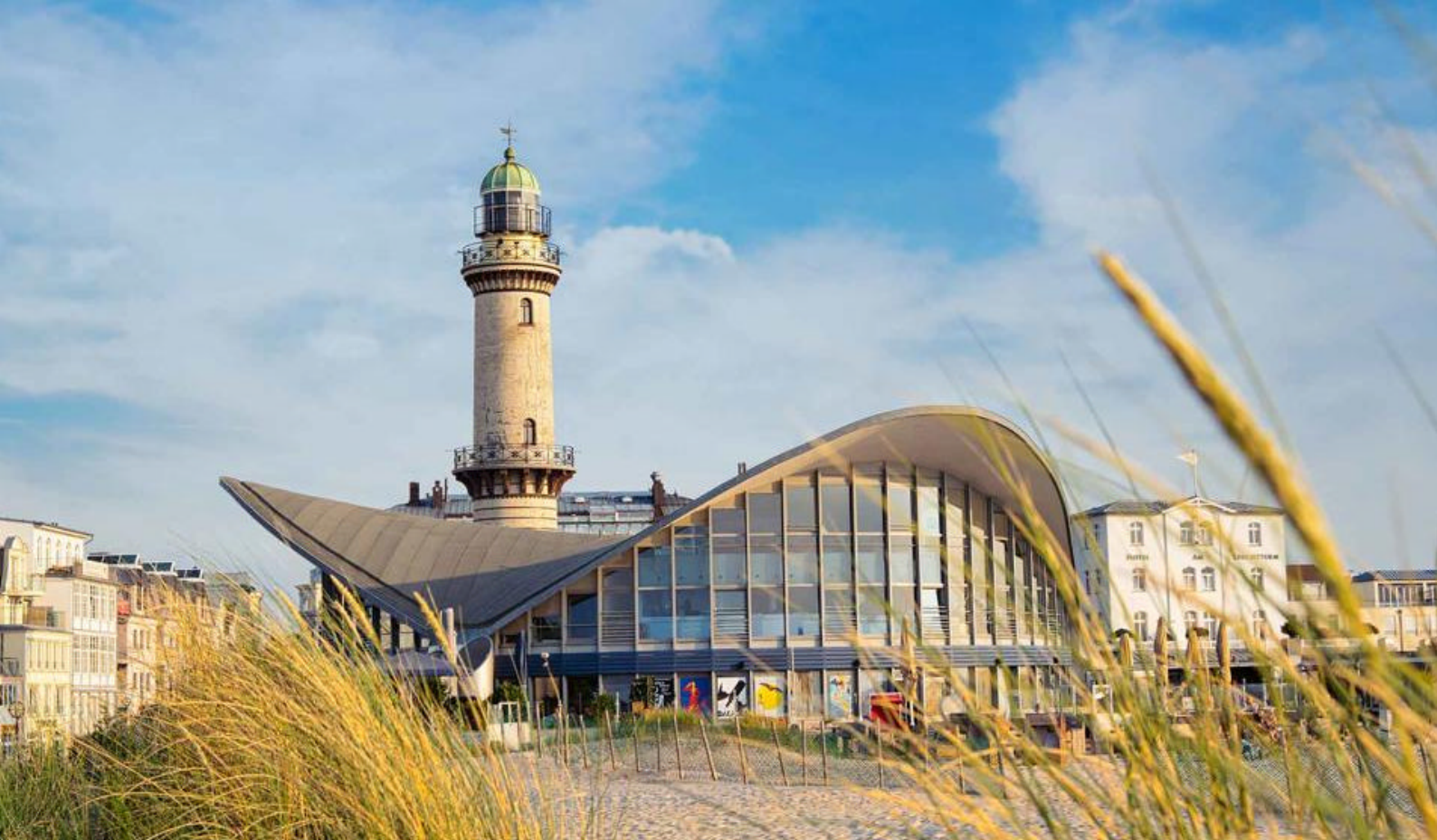
Fyrtårnet Teepott i Warnemünde, Tyskland