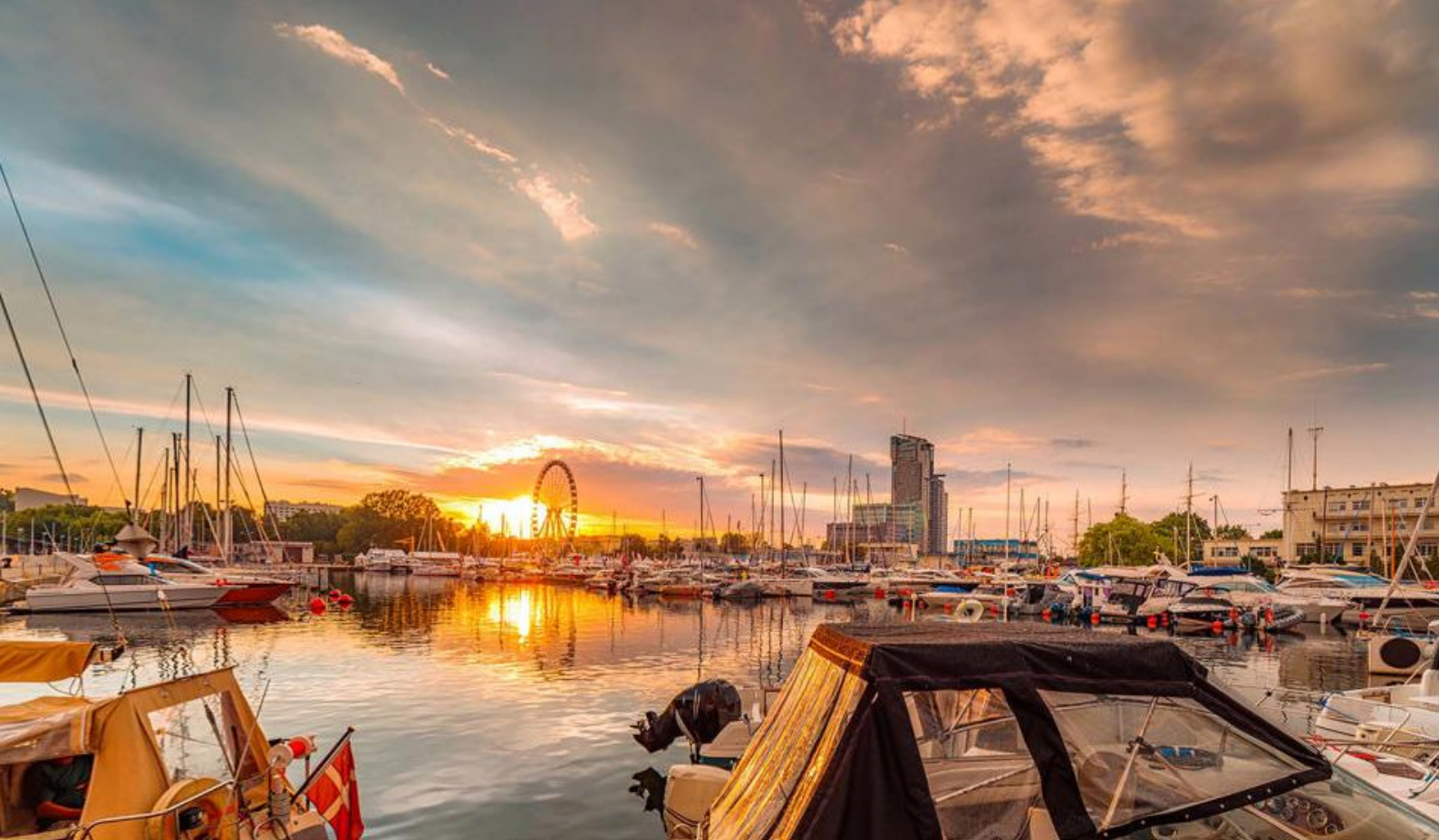
Havnen i Gdynia, Polen

Måltider inkluderet: All inclusive på skibet Indkvartering: MSC Poesia