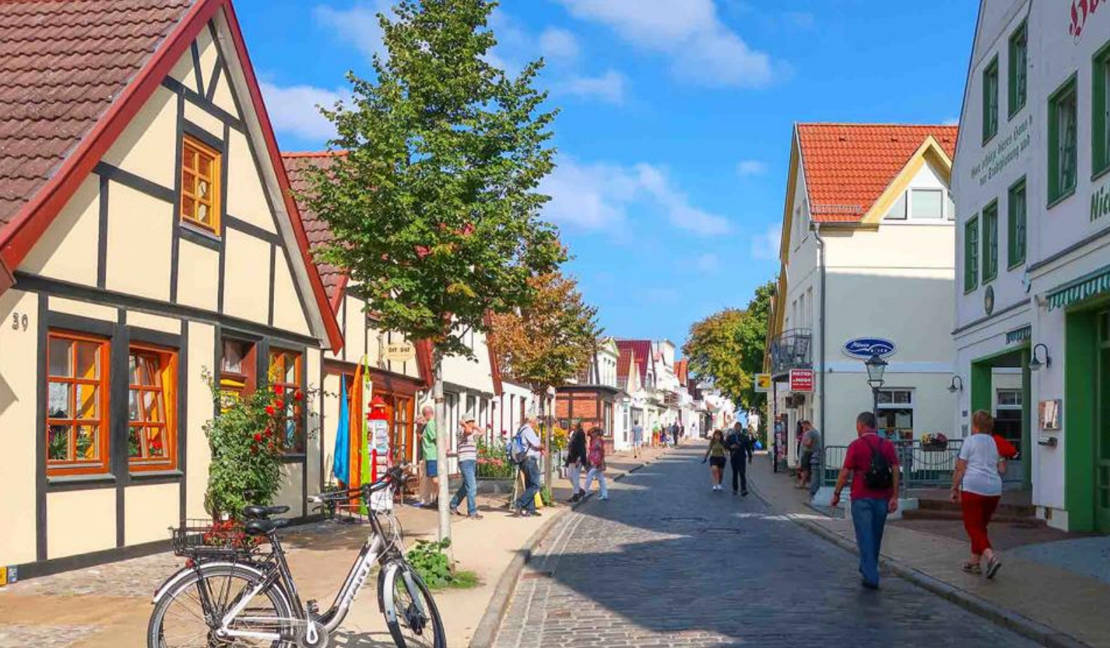
En af gågaderne i Warnemünde, Tyskland