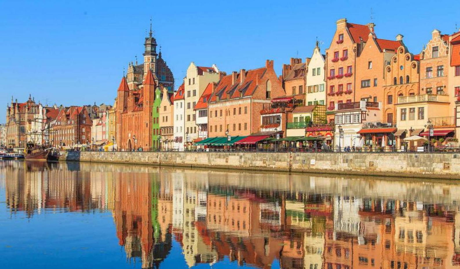
Kajen ved Gdynia, Polen