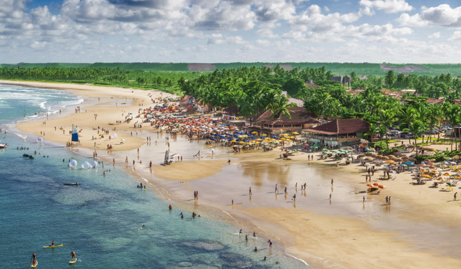
Maceio i Brasilien