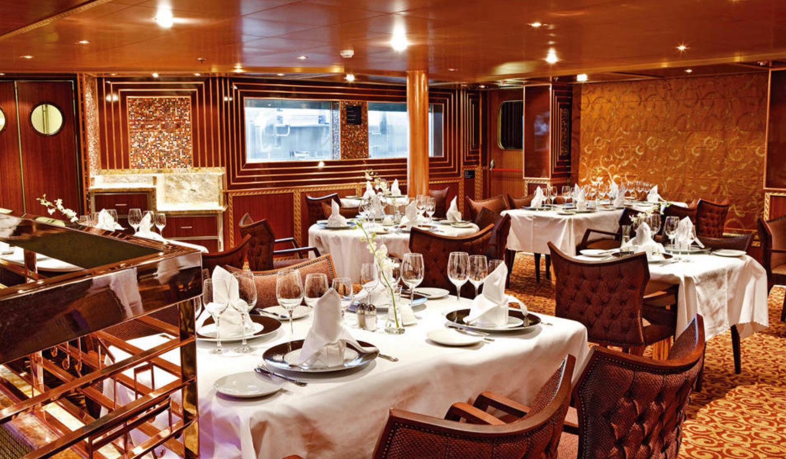
Nyd god mad ombord på Costa Pacifica