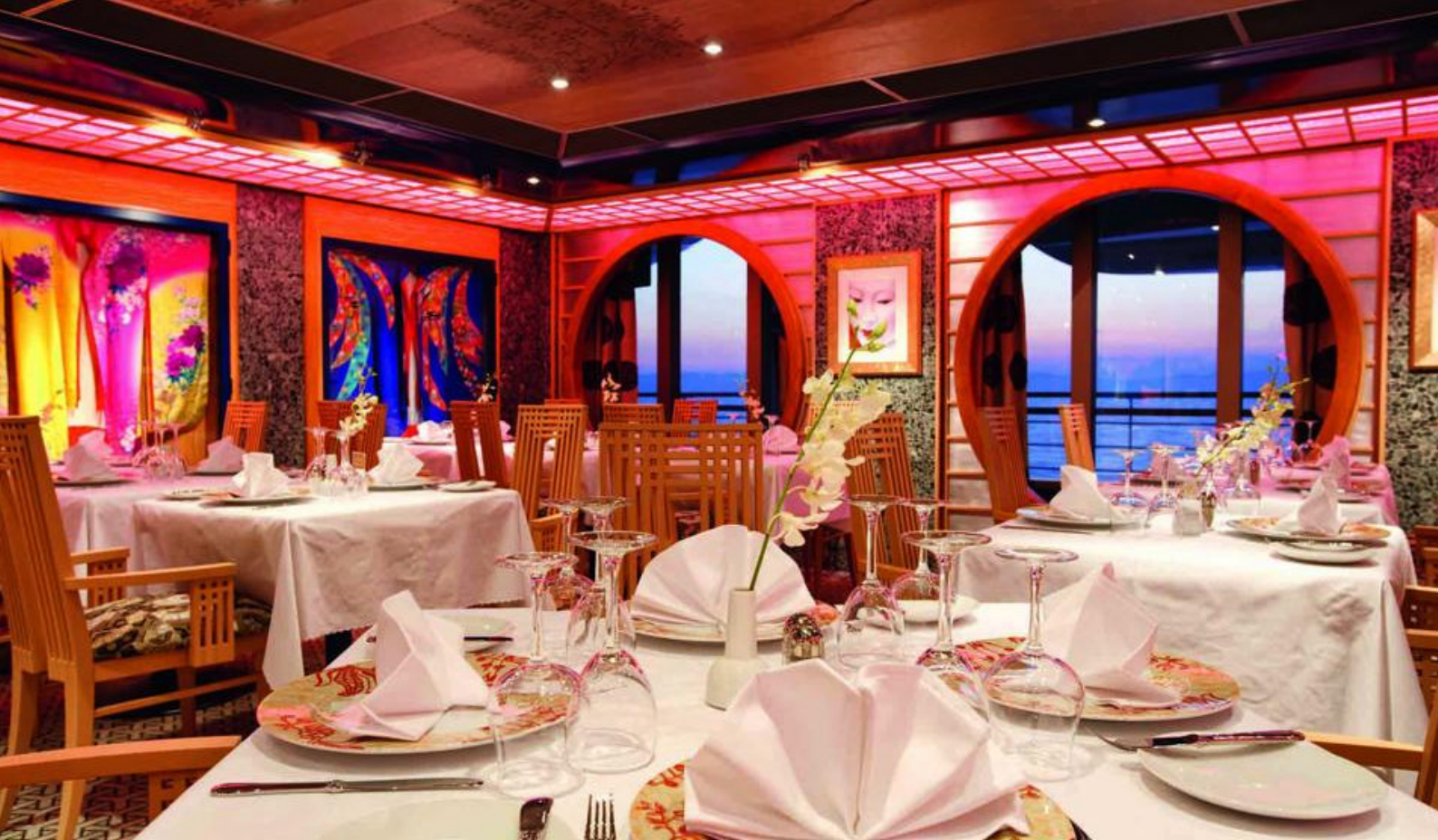
Restaurant, Costa Pacifica

Udover at være Brasiliens mest moderne by, er Recife kendt for byens lange sandstrande, næsten utallige skyskrabere og en hyggelig bykerne med masser af historie.