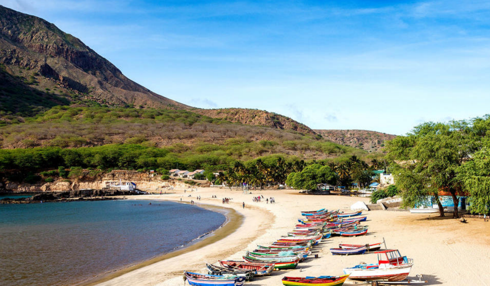
Strand på øen Santiago, Kap Verde