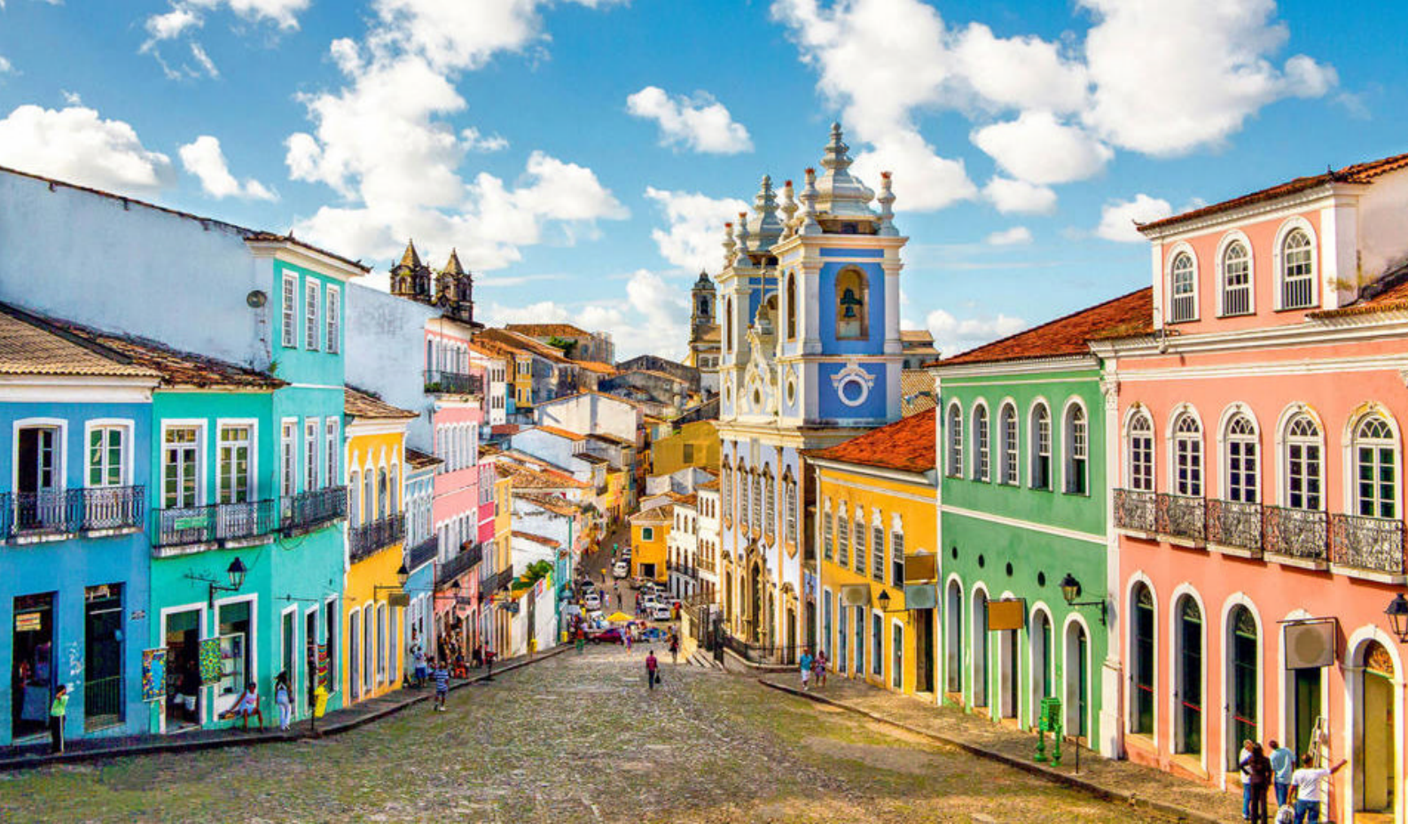
Farverig arkitektur i Salvador Bahia

afrejse' ikke inkluderer en rejseleder, da vi har erfaring for, at man ikke har brug for en fast rejseleder på krydstogter. Dette er også med til at give jer en lavere pris.