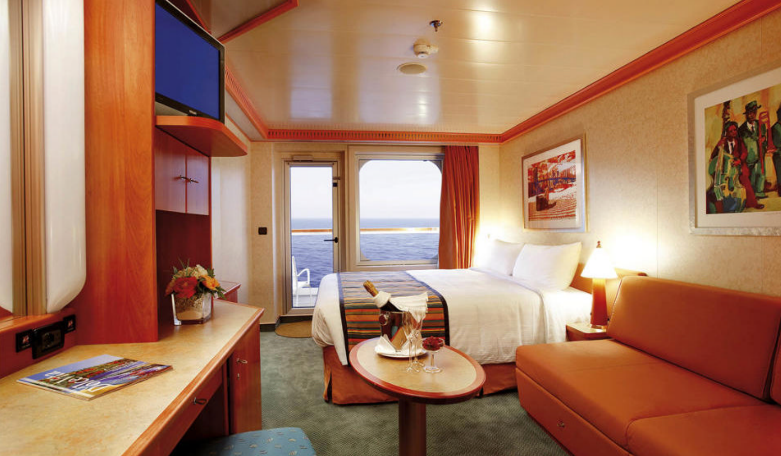
Balkonkahyt på Costa Pacifica