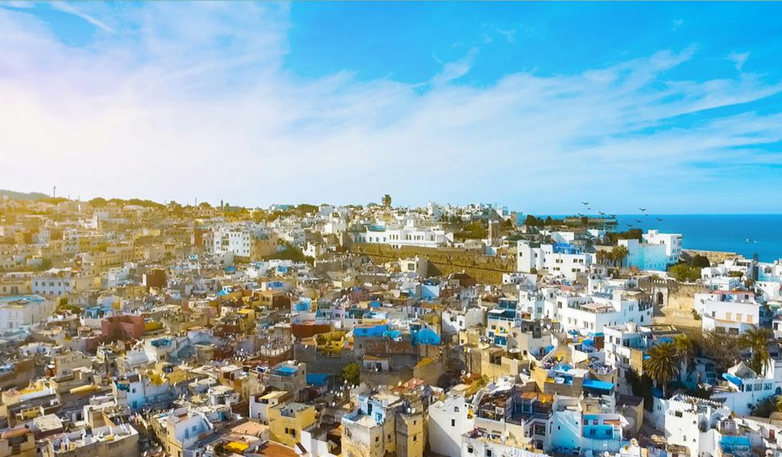
Udsigt over Tanger