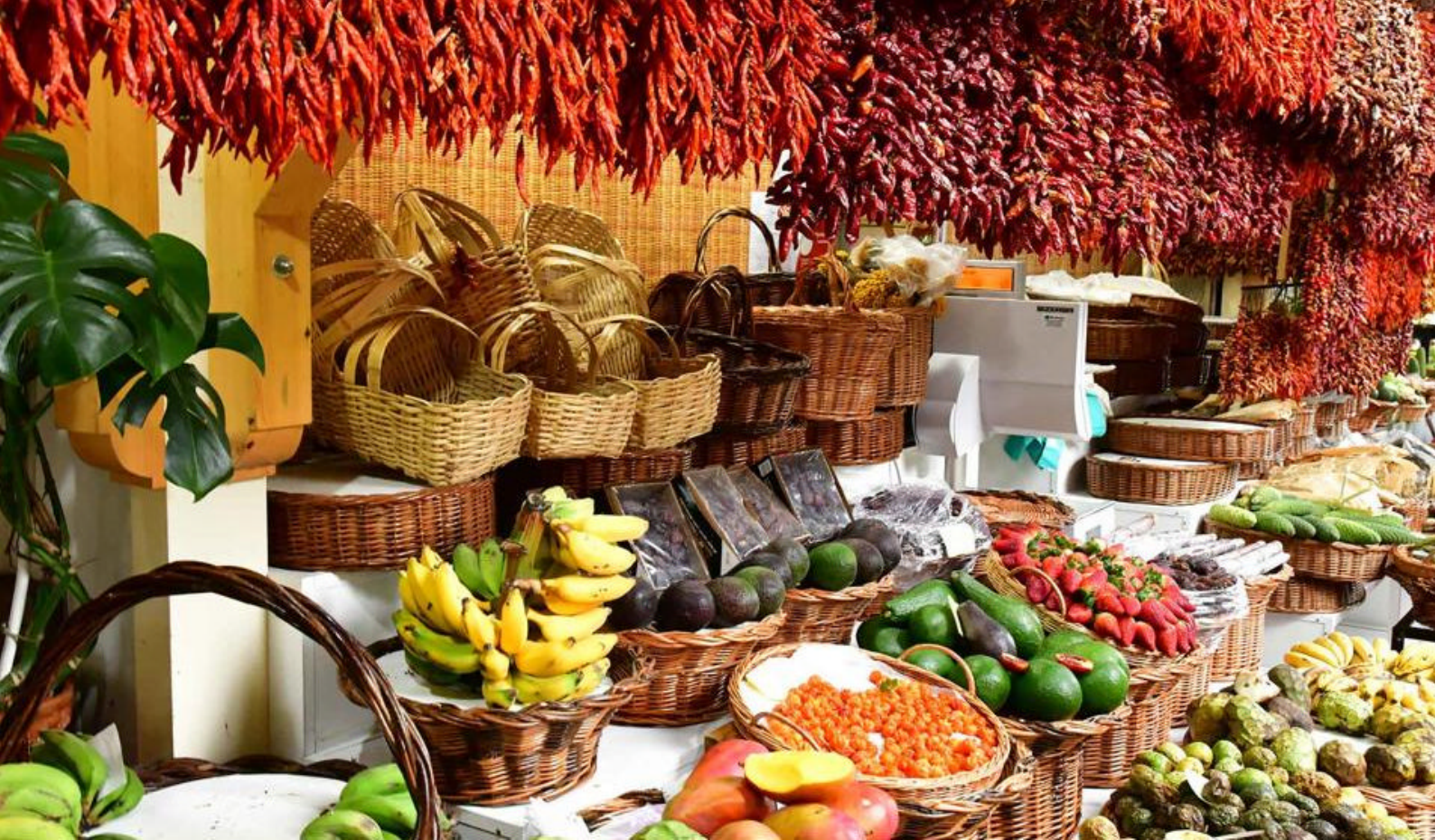
Frisk frugt fra markeder i Funchal, Madeira

Hvis I har tid, bør I også prøve en tur med toboggan-sleden fra bjergtoppen ned til Funchal.