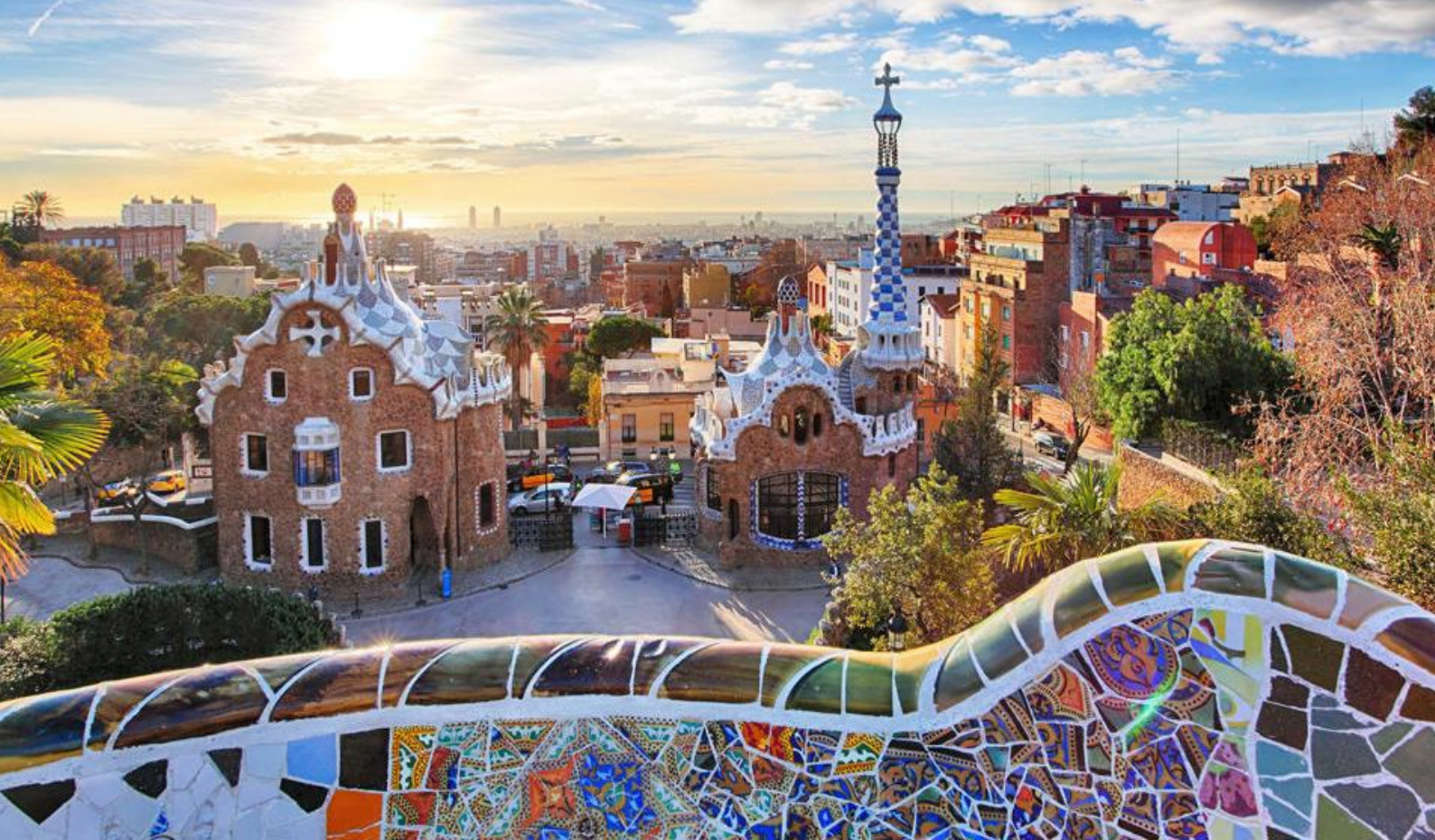
Arkitektur i Barcelona af Gaudí

Skibet lægger til kaj kl. 14.00 i Barcelona, og I har indtil kl. 19.00 til at opleve denne fantastiske metropol.