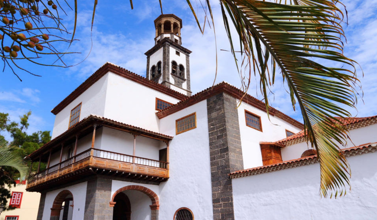
Kirke, Santa Cruz, Tenerife

svævebanen op til Sukkertoppen. Her vil I få en helt unik 360° udsigt med fantastiske panoramaer, der inkluderer strandene Leme, Copacabana og Flamengo, bjergene Pedra da Gávea, Maciço da Tijuca og Corcovado, Guanabara-bugten, centrum, Rio-Niterói-broen og Serra do Mar-bjergkæden i baggrunden, med den kendte Dedo de Deus ("Guds Finger") top. Dagen i dag er til for at nyde de mange uforglemmelige øjeblikke.