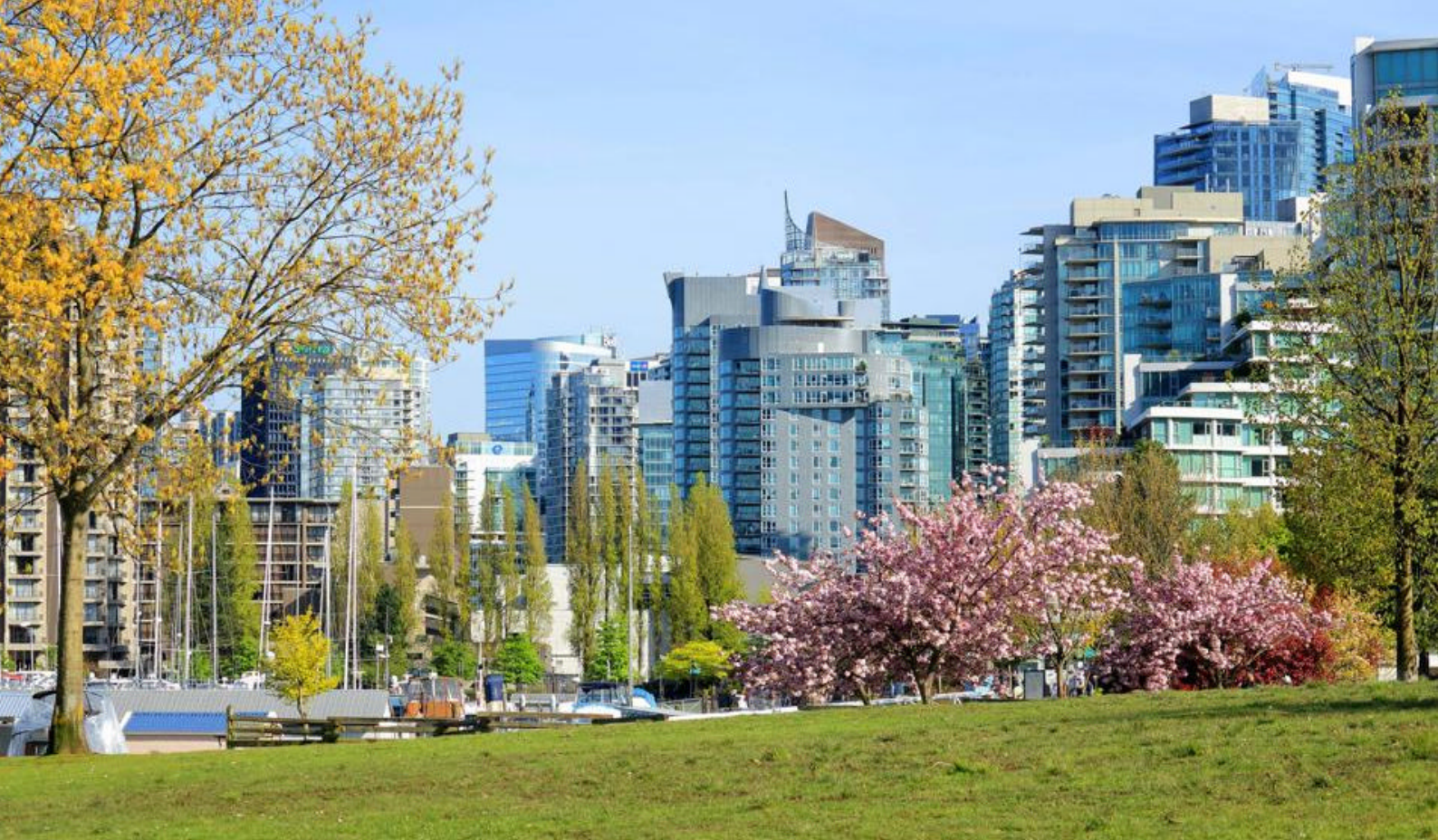
Det urbane møder naturen i Vancouver