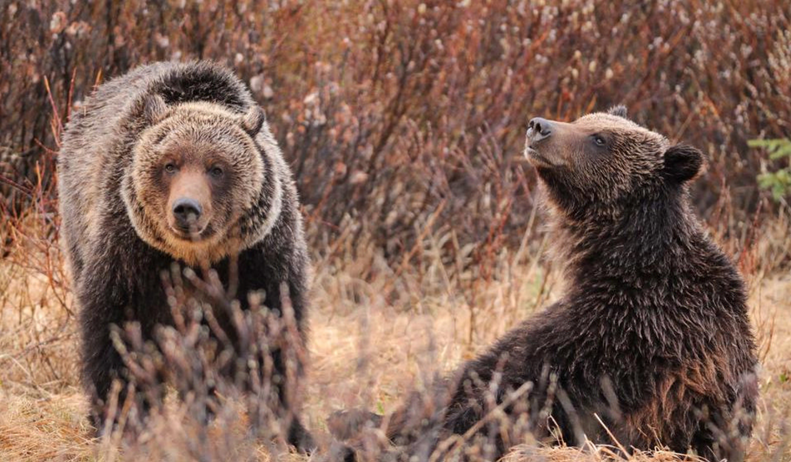
Grizzlybjørne i Jasper National Park

Premium overnatning: Kwa'lilas Hotel eller tilsvarende