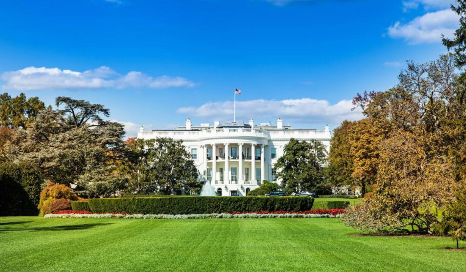
Det Hvide Hus i Washington D.C.

en historie om menneskets forhold til naturen samt det komplekse samspil mellem plantageejere, landskab og flora gennem tidens gang.