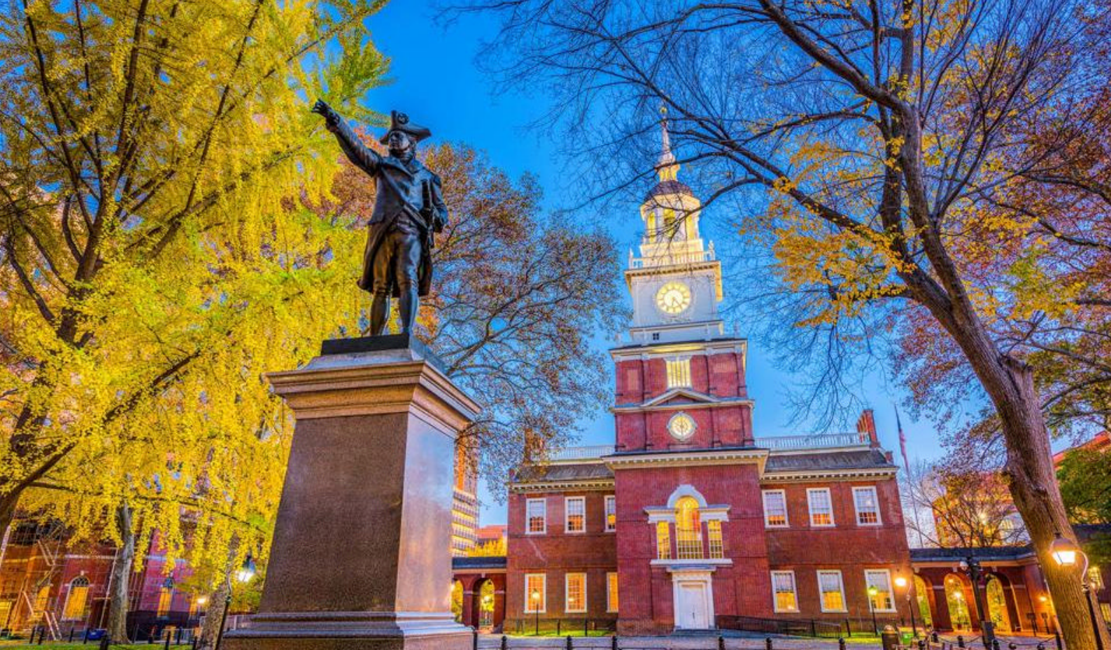
Independence Hall i Philadelphia

Et godt tip er at begynde jeres cykeltur ved Georgetown Waterfront Park. Dette område tilbyder ikke kun en fantastisk udsigt, men er også hjemsted for cykelstier og butikker, der gør det til et ideelt startsted. Kun et stenkast fra området ligger National Mall, hvor der er mulighed for at beundre bl.a. Lincoln Memorial og Washington Monument. Herfra anbefaler vi at cykle videre langs Pennsylvania Avenue, hvor Det Hvide Hus ligger.