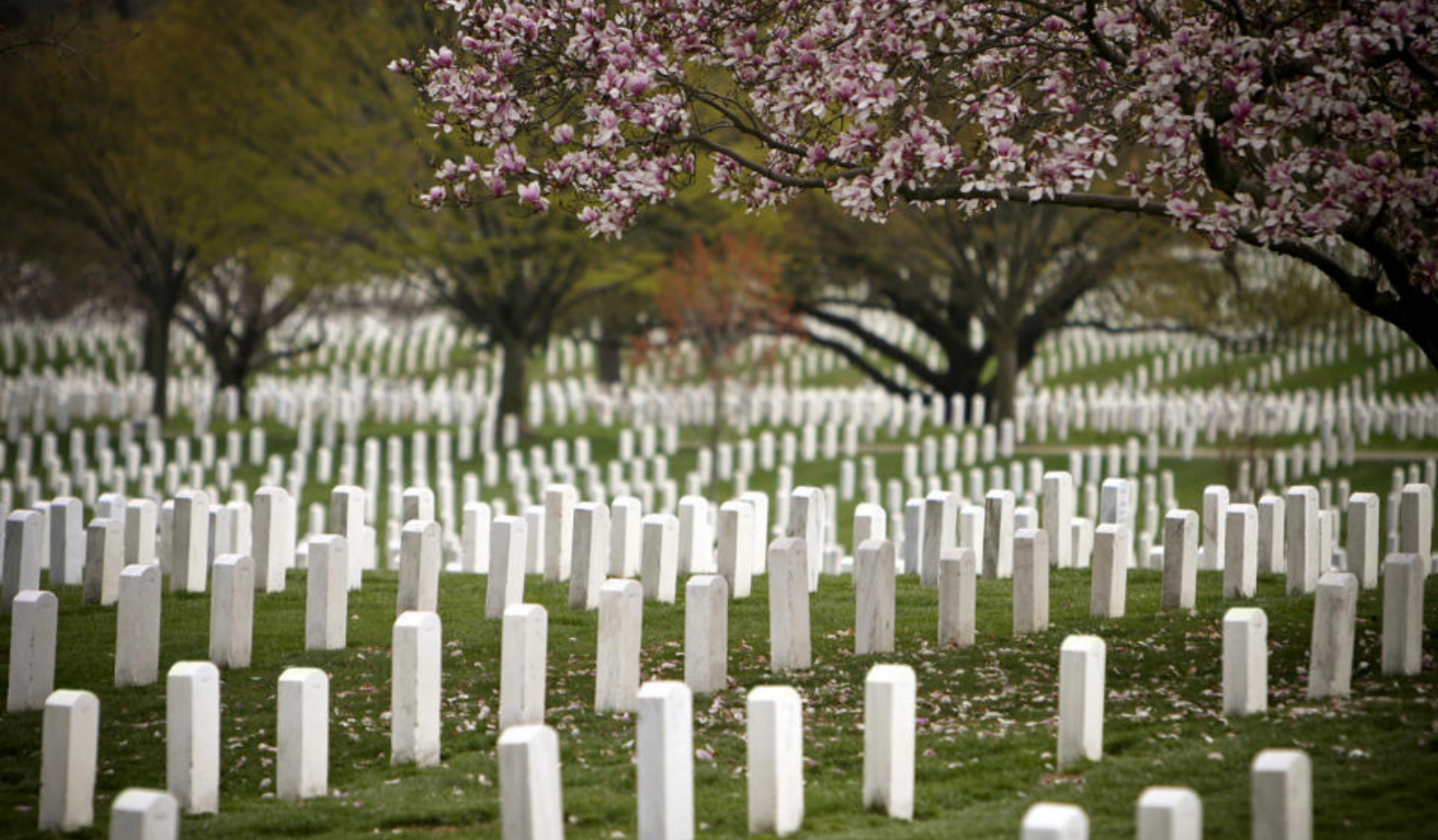
Arlington National Cemetery i Washington D.C.

denne dag også se frem til opleve en Ghosts & Gravestone-aftentur, der byder på en spændende og uhyggelig rejse gennem tidligere slagmarker, historiske kirkegårde og gamle palæer, alt imens I hører fortællinger om mord, kaos og andre mystiske begivenheder i den hjemsøgte by.