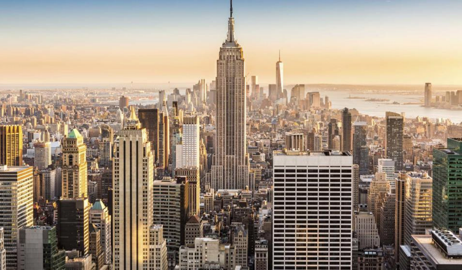
Manhattans fascinerende skyline