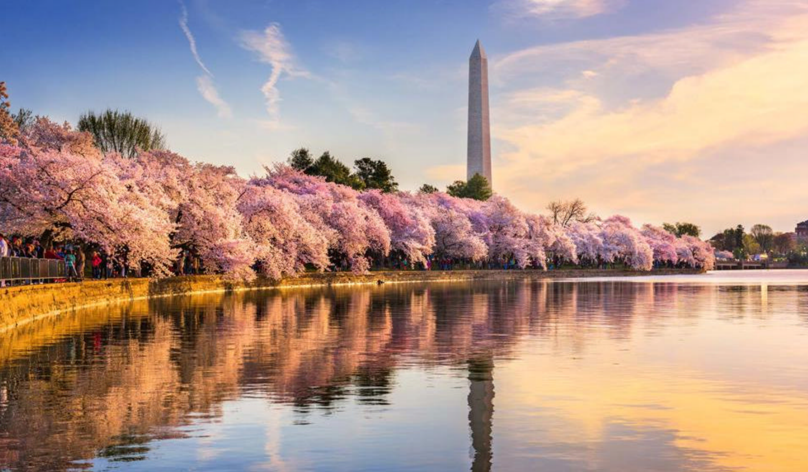
Blomstrende kirsebærtræer på National Mall i Washington D.C.

vant til de andre dage. Her vil togturen nemlig vare cirka 7 timer, inden I ankommer til South Carolinas perle.