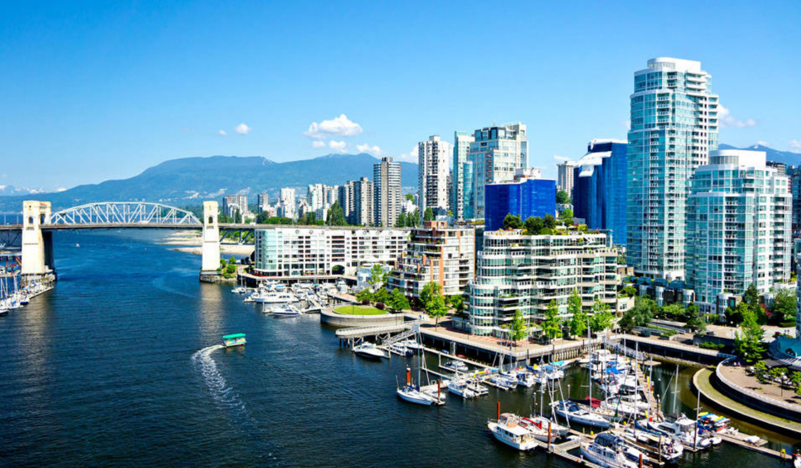
Rejsen kan starte i storbyen Vancouver