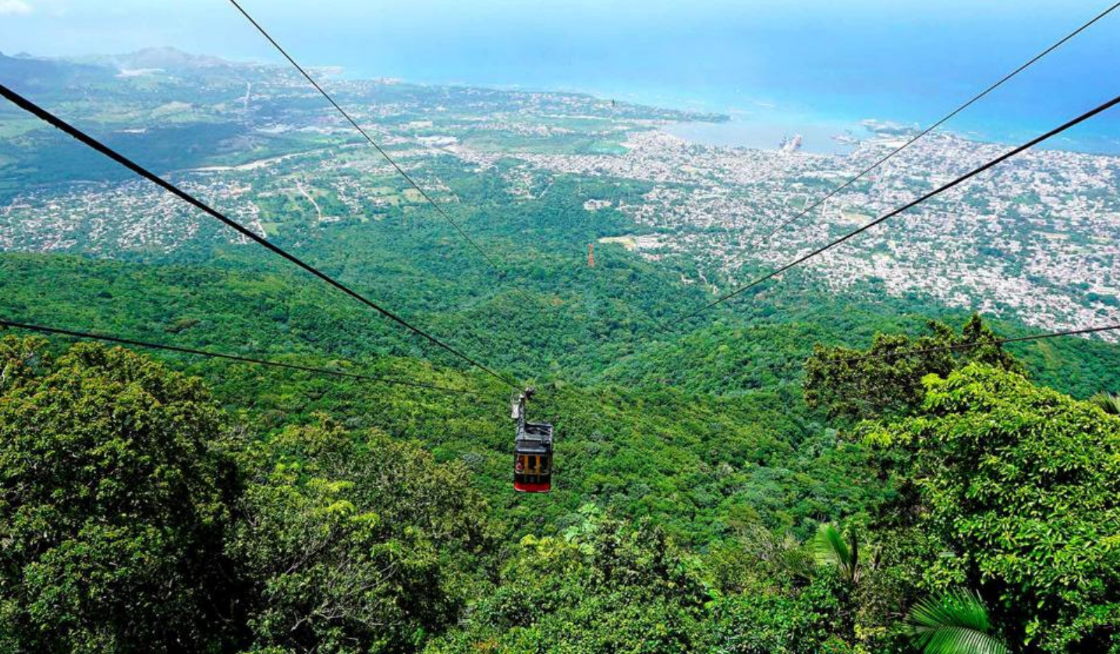
Kabelbanen i Pico Isabel de Torres

Derudover kan I tage ind i den charmerende by Puerto Plata, hvor I kan udforske de farverige bygninger og besøge det lokale marked for at købe souvenirs.