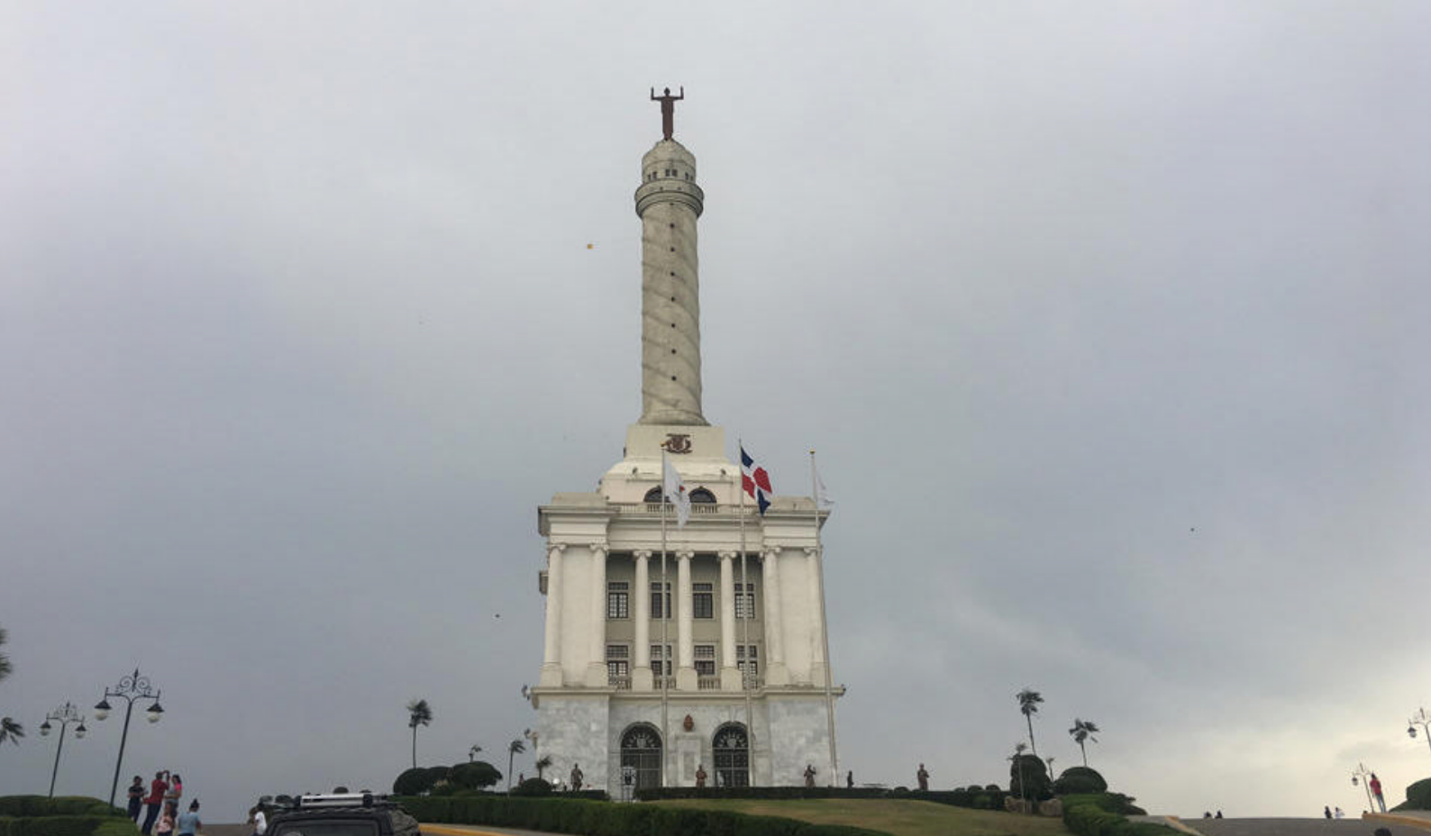
Besøg monumentet i Santiago de los Caballeros

bruge de naturlige vandrutsjebaner eller springe fra klippeafsæt fra imponerende højder ned i det kølige vand. Mellem passagerne vil I krydse strømfald, der fører til det næste vandfald.