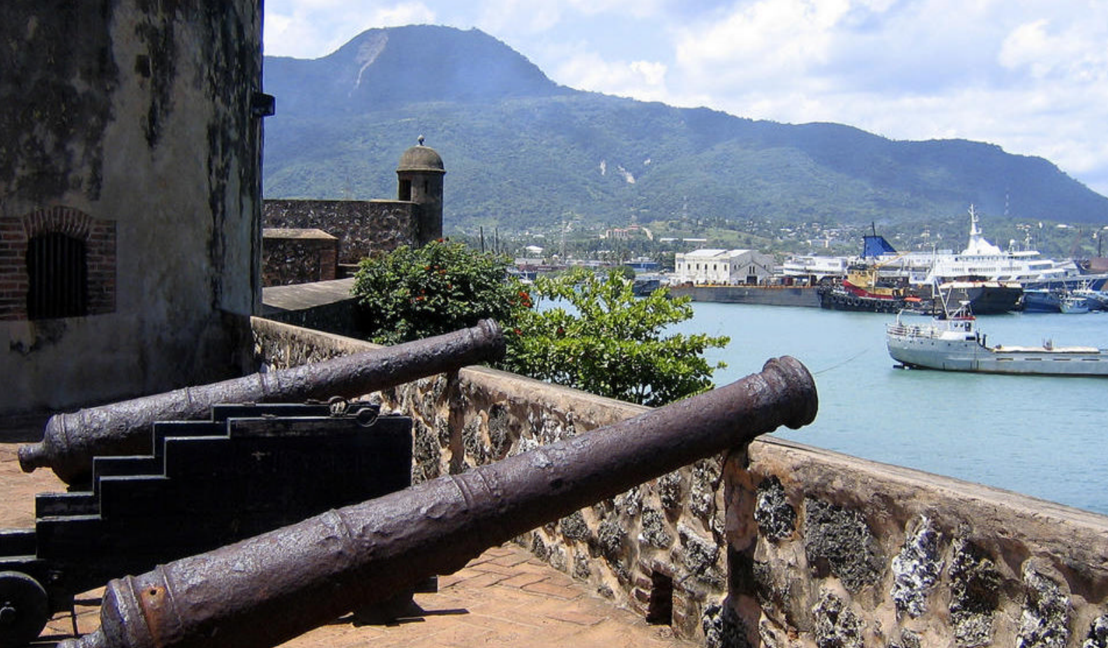
San Felipe-fortet i Puerto Plata