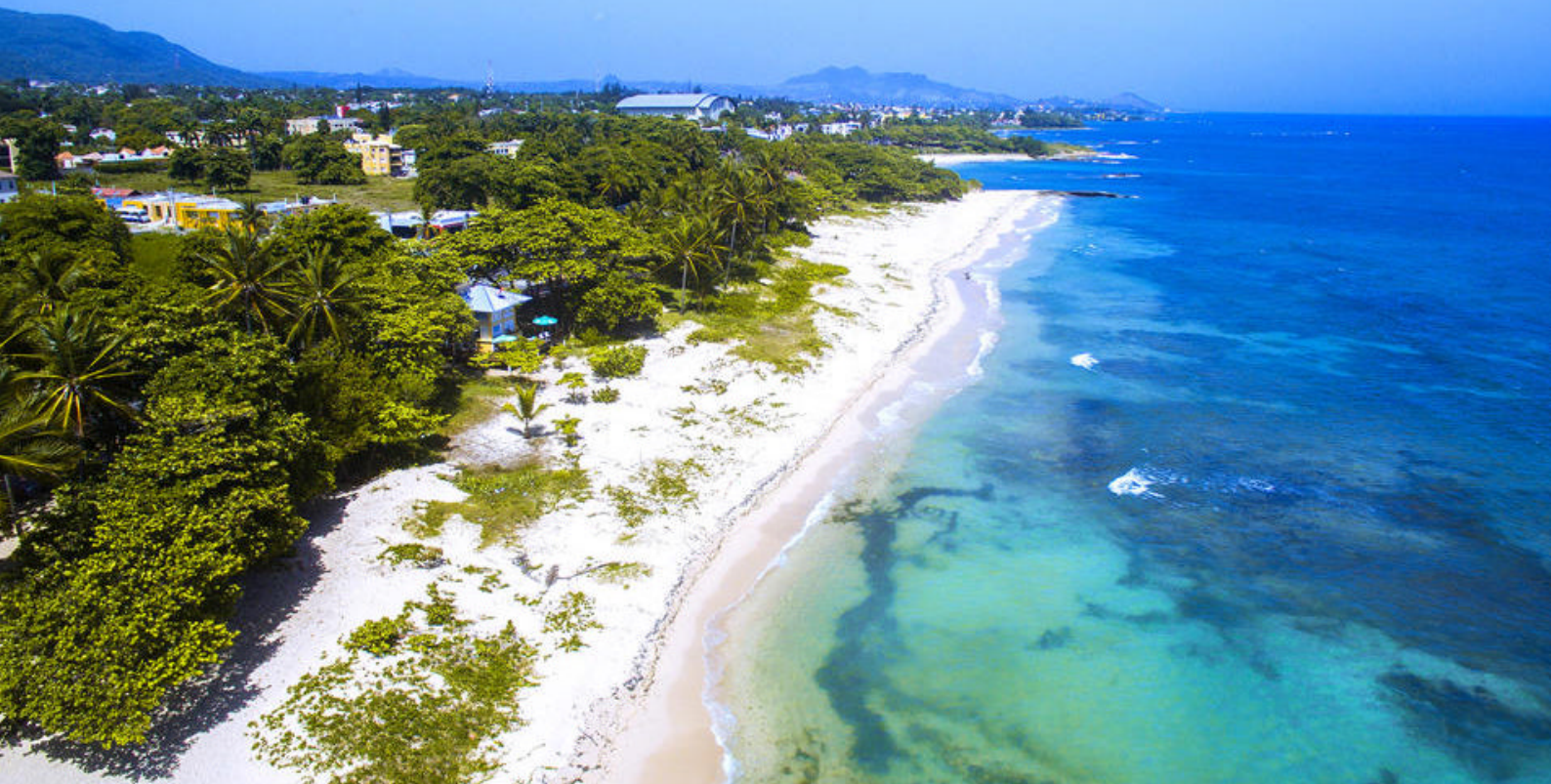
Stranden ved Puerto Plata

badestop. Fortsæt til næste strand og badestop: Playa Caletón.