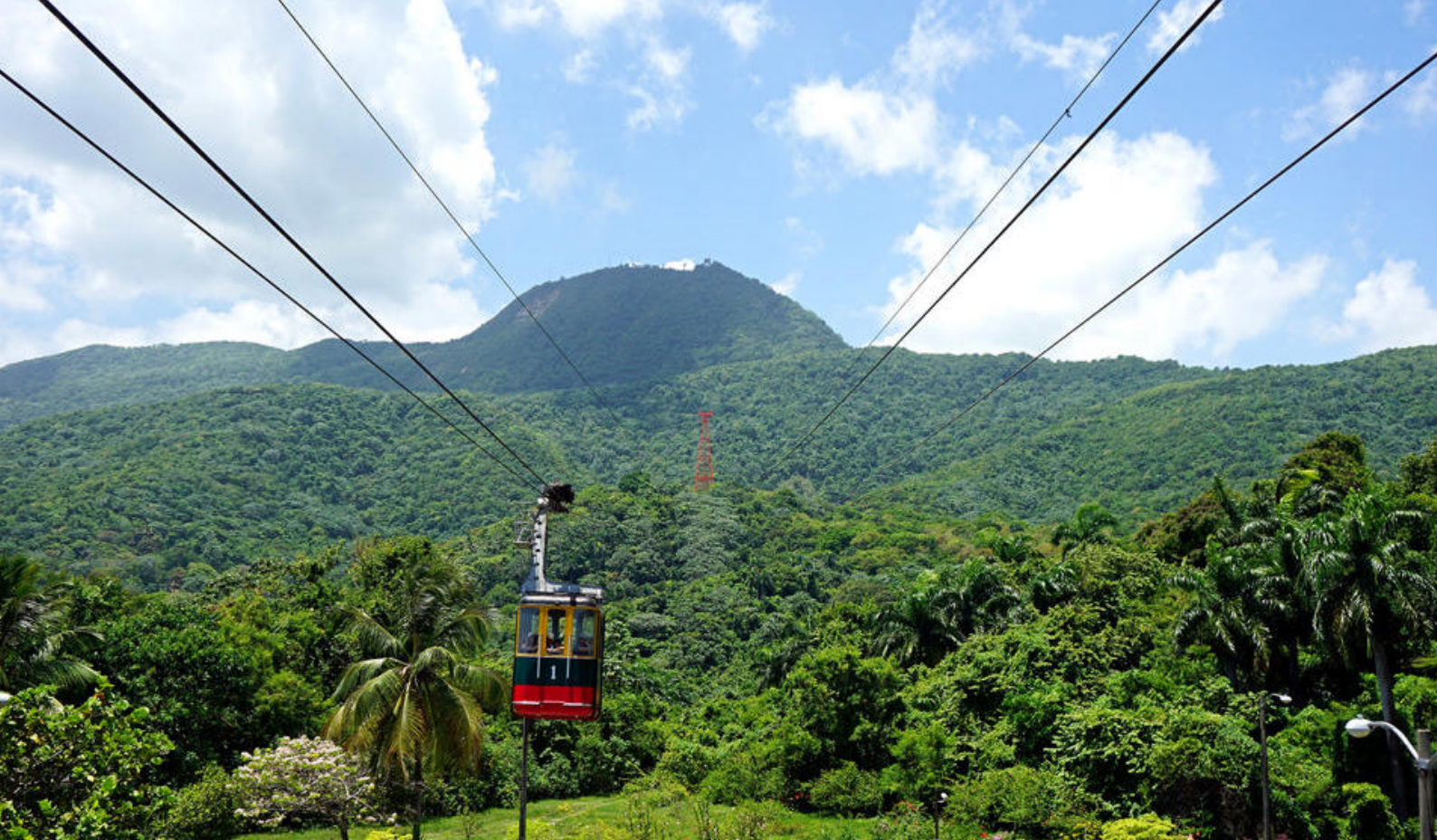
Tag kabelbanen i Pico Isabel de Torres udenfor Puerto Plata